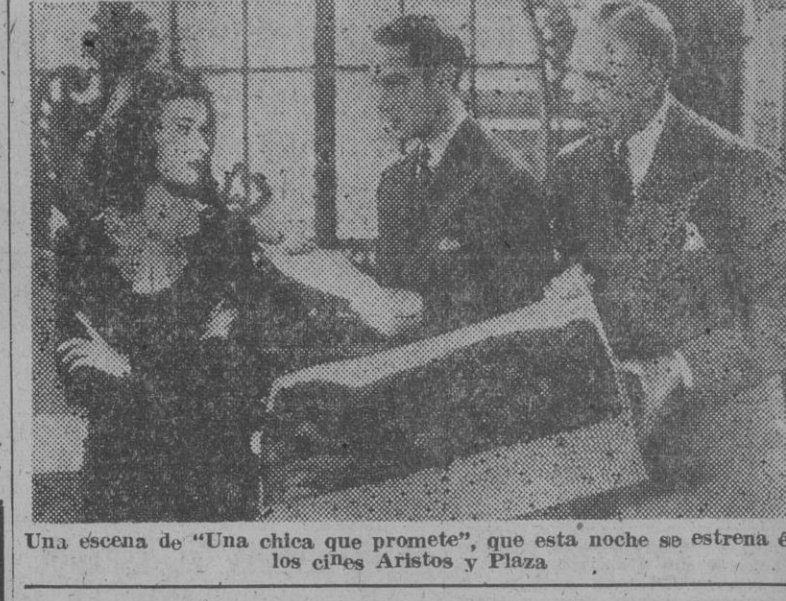
Una escena de "Una chica que promete", que esta noche se estrena en los cines Aristos y Plaza