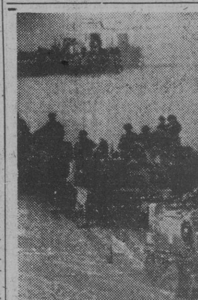
Unidades motorizadas de las fuerzas aliadas, recientemente desembarcadas en Nettuno se dirigen a los puestos de primera línea. II.—Infantería del Ejército norteamericano, desplegándose en formación de combate en las inmediaciones de la zona de desembarco. (Fotos recibidas por radio)