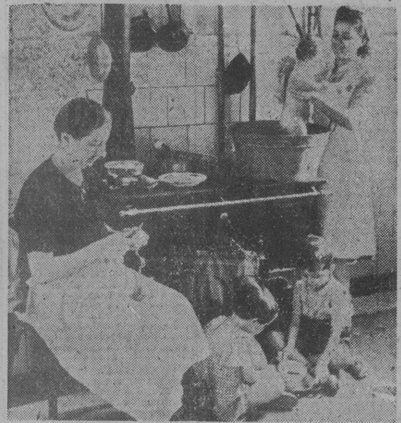
Mientras la dueña de una casa modesta atiende los quehaceres habituales de su hogar, una cumplidora del Servicio Social cuida con esmero del más pequeño de sus habitantes.