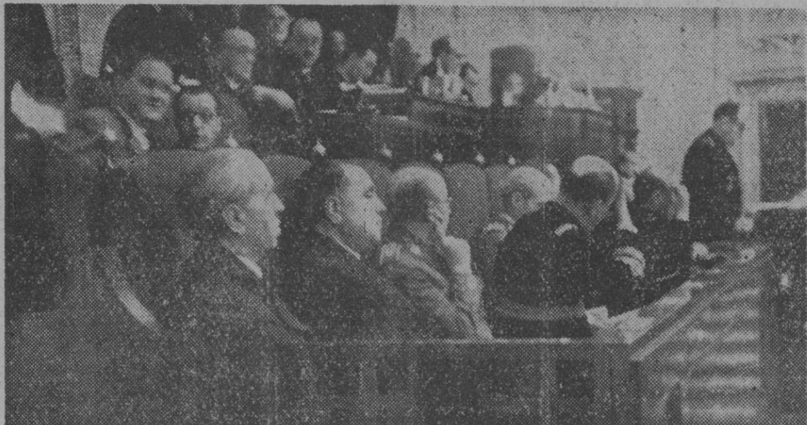
La mesa presidencial de las Cortes durante la sesión del día 29. El Gobierno, y en primer término, el ministro de Hacienda que dio cuenta a la Cámara de la situación de la Hacienda.