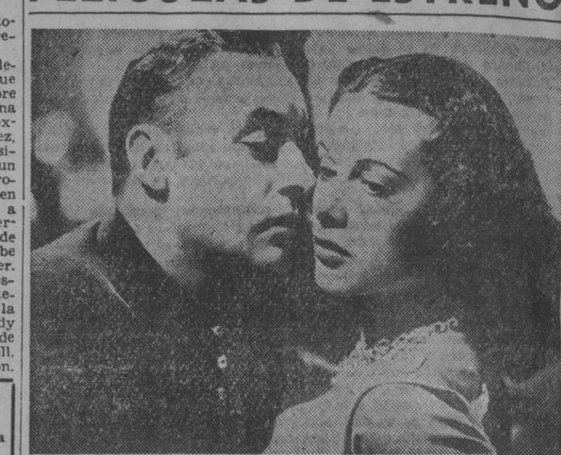
Charles Boyer y Hedy Lamarr en un primer plano emocionante de la película «Argel», que hoy se estrena en el cine Astoria