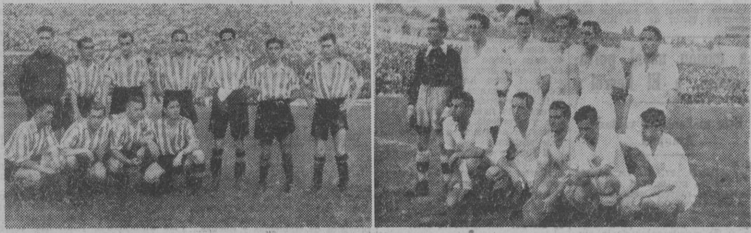
Los equipos del Atlético de Bilbao y Real Madrid, que se enfrentaron ayer en el Estadio Metropolitano, de Madrid.

más cálidas ovaciones. Pero no tuvo el acierto de encontrar el hueco de la puerta de Lezama y el fácil rematador que llevara el balón hacia el fondo de la red. Buenas ocasiones tuvo, pero unas veces el larguero, otras, las más, la magnífica actuación del meta bilbaíno y las manos, dos o tres, intervenciones de Alsúa poco eficaces, que tendieron a sus pies los goles de la victoria en ocasiones. En la delantera, Panizo y Gaitza, pero hay que reconocer que los dos interiores atléticos no brillaron por su fama y que recayó el juego demasiado sobre Panizo, que no pudo demostrar sus grandes condiciones de interior.