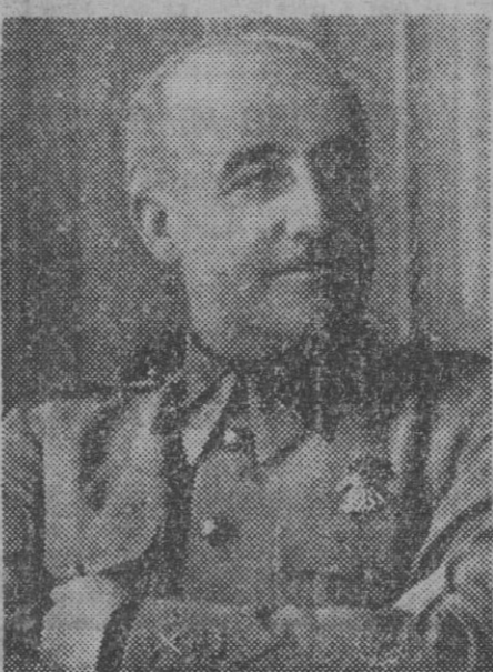
Haro, Cremades, el Gobernador civil de Valencia, coronel Planas de Tovar.

La comitiva se dirigió por las Rondas y desembocó en el Puente de Piedra, y, al igual que en todo el trayecto, hasta la Academia General Militar, la muchedumbre enronquecía vitoreando al Caudillo.