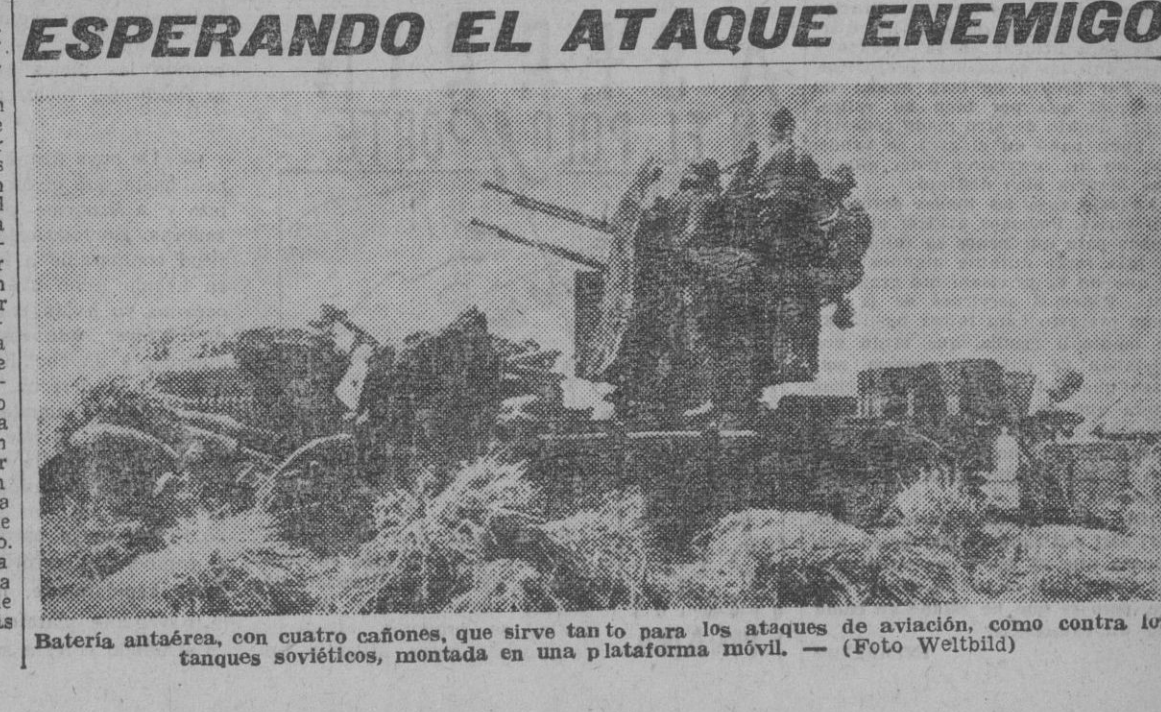
Batería antaérea, con cuatro cañones, que sirve tanto para los ataques de aviación, como contra los tanques soviéticos, montada en una plataforma móvil.