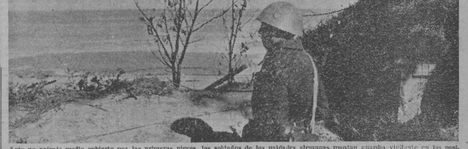
Ante un paisaje medio cubierto por las primeras nieves, los soldados de las unidades alemanas montan guardia vigilante en las posiciones conquistadas en el Cáucaso, atentos siempre a los movimientos del adversario e impedir toda sorpresa.