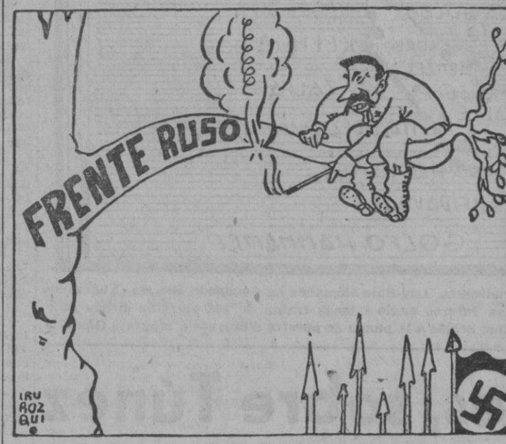
STALIN: — ¡Je! ¡Je! Ahora voy y lo rompo por aquí.