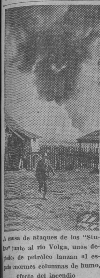
A causa de ataques de los "Stukas" junto al río Volga, unos depósitos de petróleo lanzan al espacio enormes columnas de humo, efecto del incendio

Sólo hubo seis muertos y 21 heridos en Tolón