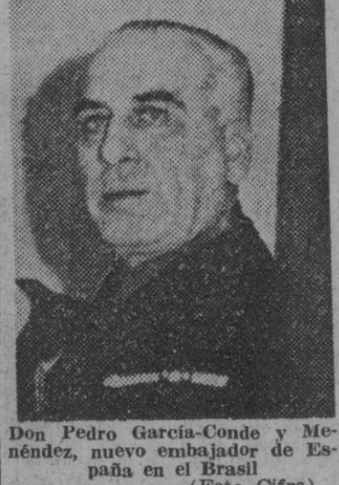
Don Pedro García-Condé y Espinosa, nuevo embajador de España en el Brasil.