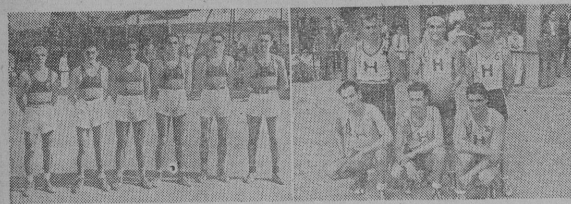
Los equipos del Barcelona y Hospitalet.

Resultados y comentarios a la tercera jornada del Campeonato de Cataluña