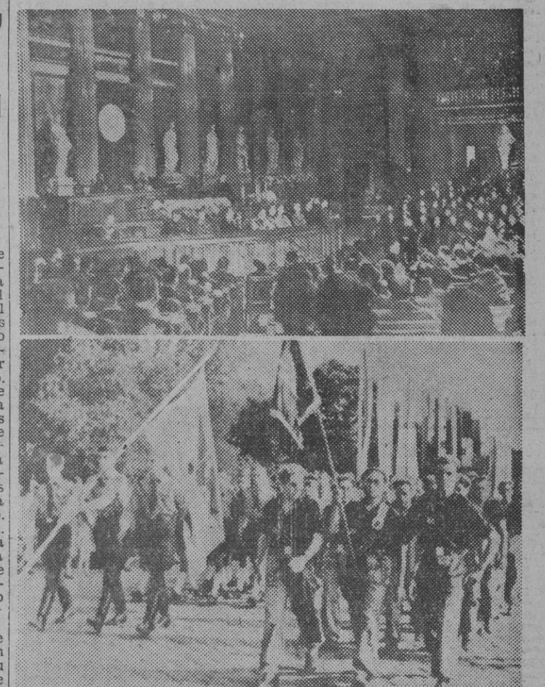
La sesión de clausura del Congreso de las Juventudes Europeas, celebrado en el "Ring" de Viena; y un desfile de camaradas españoles ante las representaciones oficiales que han asistido al referido Congreso.

El Congreso de las Juventudes Europeas, en Viena