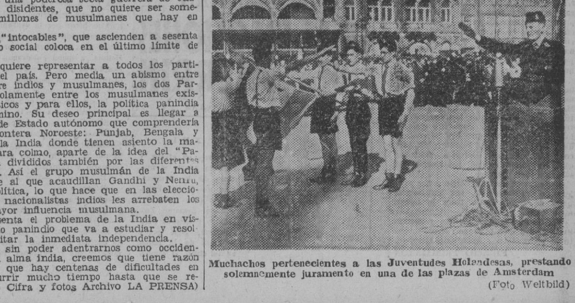
Muchachos pertenecientes a las Juventudes Holandesas, prestando solemnemente juramento en una de las plazas de Amsterdam.