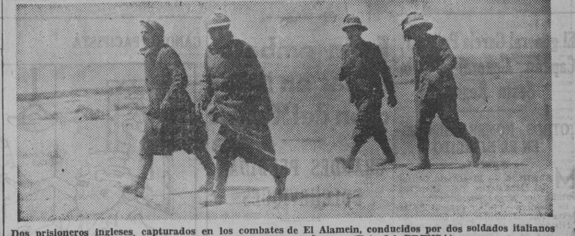
Dos prisioneros ingleses, capturados en los combates de El Alamein, conducidos por dos soldados italianos al puesto de mando para ser interrogados.