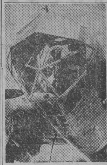
El mariscal Keiserling, en la cabina de su avión.