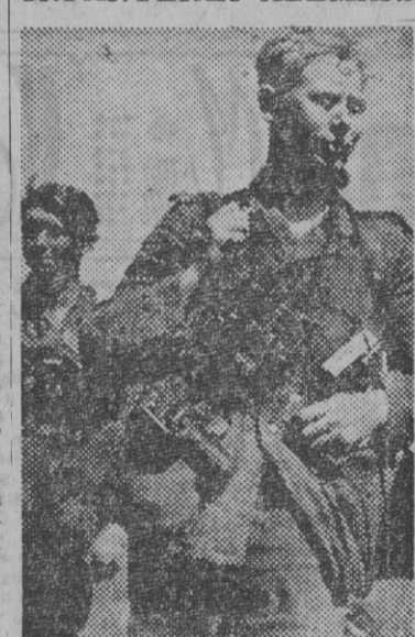
Una marcha en el sector meridional del frente ruso se efectúa bajo los efectos de una alta temperatura. Los soldados avanzan con la cabeza descubierta para atenuar los rigores solares.