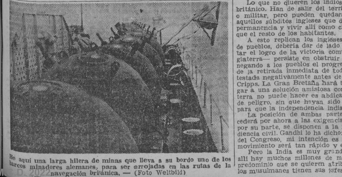
He aquí una larga hilera de minas que lleva a su bordo uno de los buques minadores alemanes, para ser arrojadas en las rutas de la navegación británica.