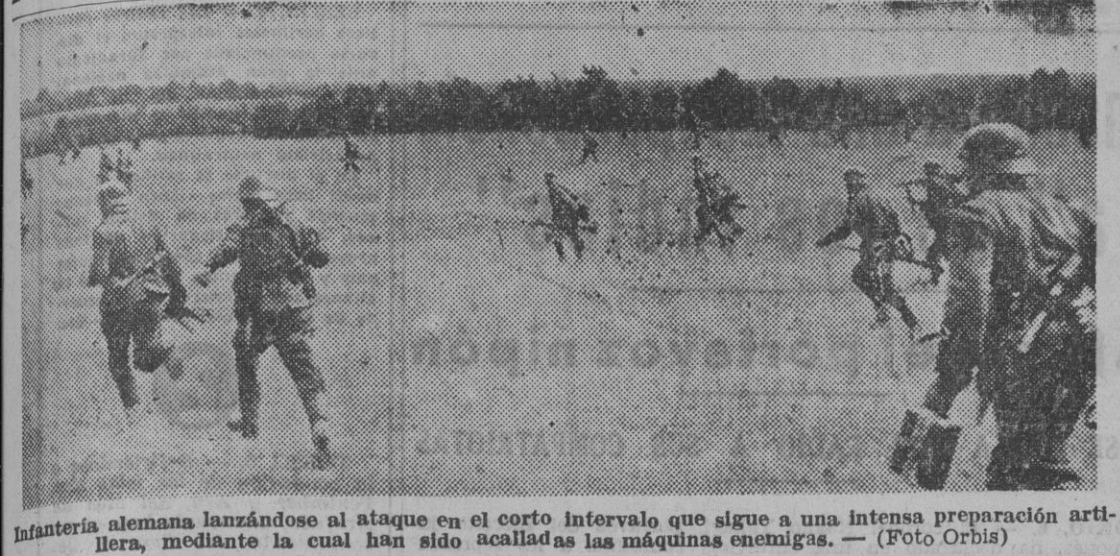
Infantería alemana lanzándose al ataque en el corto intervalo que sigue a una intensa preparación artillera, mediante la cual han sido acalladas las máquinas enemigas.