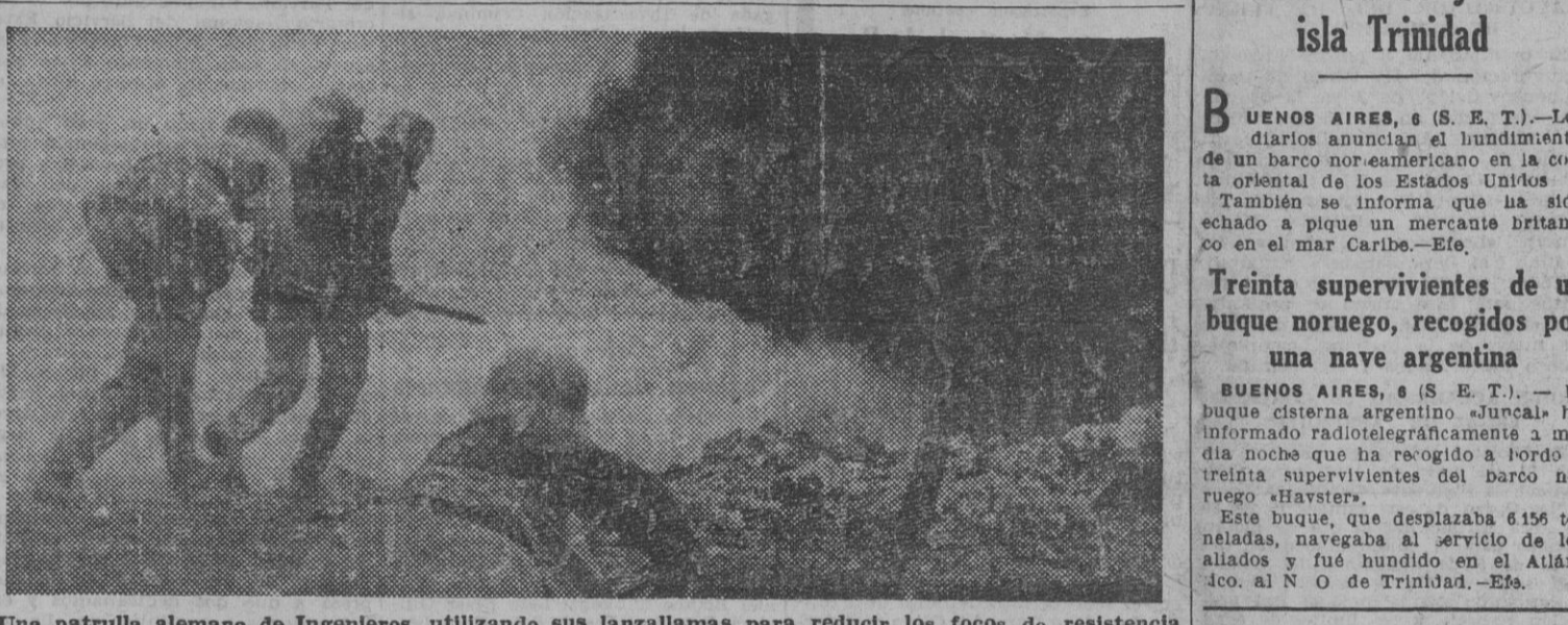
Una patrulla alemana de Ingenieros, utilizando sus lanzallamas para reducir los focos de resistencia egipcia.