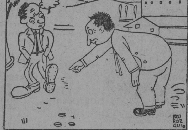
— ¿Cómo llevas esos zapatos tan grandes? — Porque en vez de darle a mi zapatero el número de mi horma le he dado el de mi teléfono.

Los Soviets esperaban la ofensiva, y se prepararon con tiempo. Bases para emprender futuras operaciones.