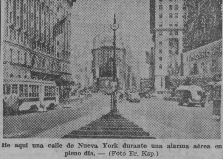
He aquí una calle de Nueva York durante una alarma aérea en pleno día.