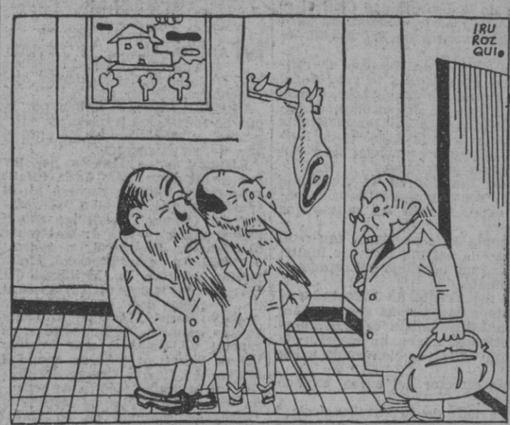
De forma que nos pide usted 24 pesetas por una docena de huevos que valen en la tienda a 12? ¿Usted lo que quiere es robarnos a las claras...