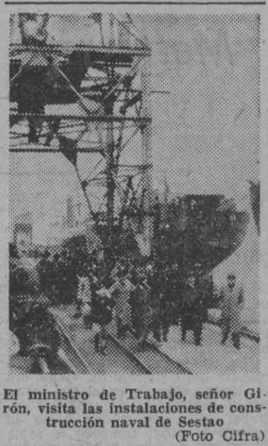
El ministro de Trabajo, señor Girón, visita las instalaciones de construcción naval de Sestao.