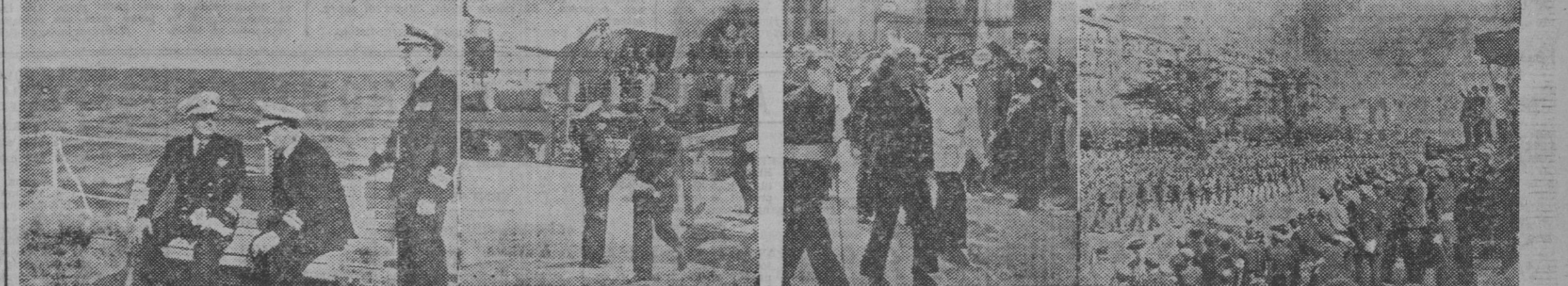
S. E. el Jefe del Estado, Generalísimo Franco, a bordo del "Almirante Cervera". El Caudillo desembarca en el puerto santanderino, siendo objeto de un entusiasta recibimiento. En las calles, el entusiasmo es innarrable, siendo constantemente aclamado. En la última foto vemos a S. E. presidiendo el grandioso desfile, en el que participa con fuerzas del Ejército y de la Falange.