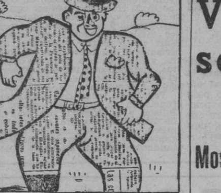
—¿Es ese el traje de los domingos, don Pígame? — ¡Ca! No lo crea, tan sólo es el de diario.