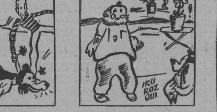
Historieta infantil, por Iru

Berlín, 25. — En el curso de su avance por la región de Molenski, los soldados alemanes han encontrado en un lugar pantanoso los cadáveres horribles mutilados de siete soldados alemanes. Se han efectuado inmediatamente las investigaciones de una aldea próxima han decido fueron heridos hechos prisioneros por los soviéticos. Los alemanes al no obtener las informaciones deseadas, los comisarios políticos atronaron las manos a la espalda a los soldados alemanes y les desataron a culatazos y bayonetas. A varios de ellos se les cortaron los brazos y las piernas con el momento de la intensa acción de la D. N. B. en forma de guante. Ninguno presentaba heridas de arma de fuego. — Efe.