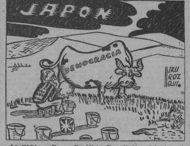
LA VACA: —¡Vamos, Franklin!... Ya está bien, deja de explotarme, que el pasto no da para tanto. — ¿Qué dices del Irán?

EN UNA GRANJA DE LOS EE. UU. Por Irurozqui