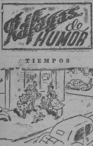
—Si vienen ustedes a casa, tomaremos una copa de vino... (De "Marc Aurelio")

Londres, 25. — En relación con la entrada de las tropas inglesas en el Irán, se hace observar en Londres —según hace saber la Agencia Reuter— que el Gobierno iraníano había indicado ya en sus respuestas a los Gobiernos inglés y soviético el 15 de agosto que no estaba dispuesto a dar satisfacciones a las recomendaciones contenidas en las notas enviadas por aquéllos.