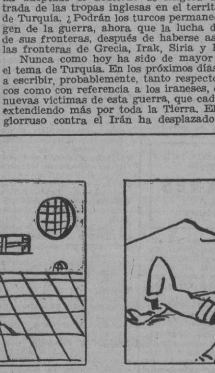
Historieta infantil, por Iru