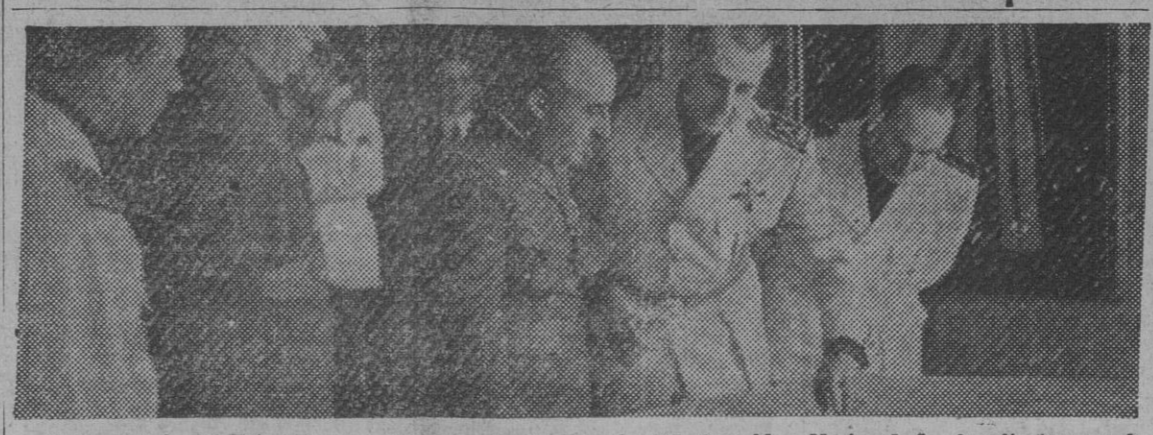
S. E. el Jefe del Estado ha presidido la clausura de la III Asamblea Nacional de Arquitectos, en la Academia de Bellas Artes de San Fernando.