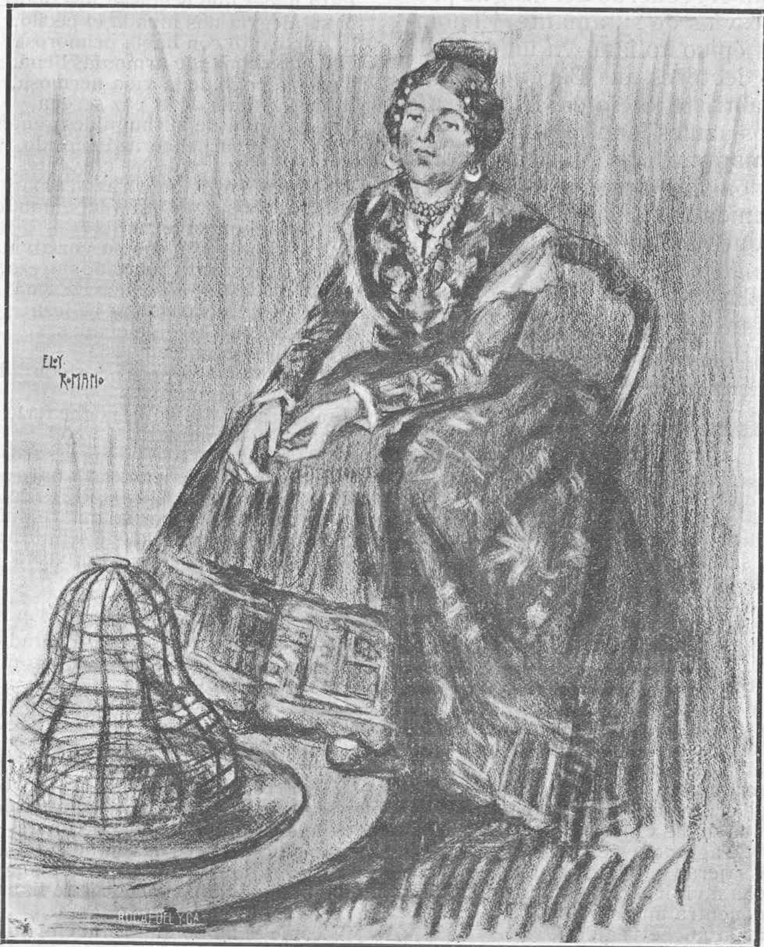
Dibujo hecho expresamente para GENTE JOVEN por D. Eloy Romano

no el más importante, creo yo que es el siguiente: reducir á un solo presidente y un solo director—como resultado de la conversión de dos Orfeones en uno—los dos presidentes y directores que en la actualidad existen.