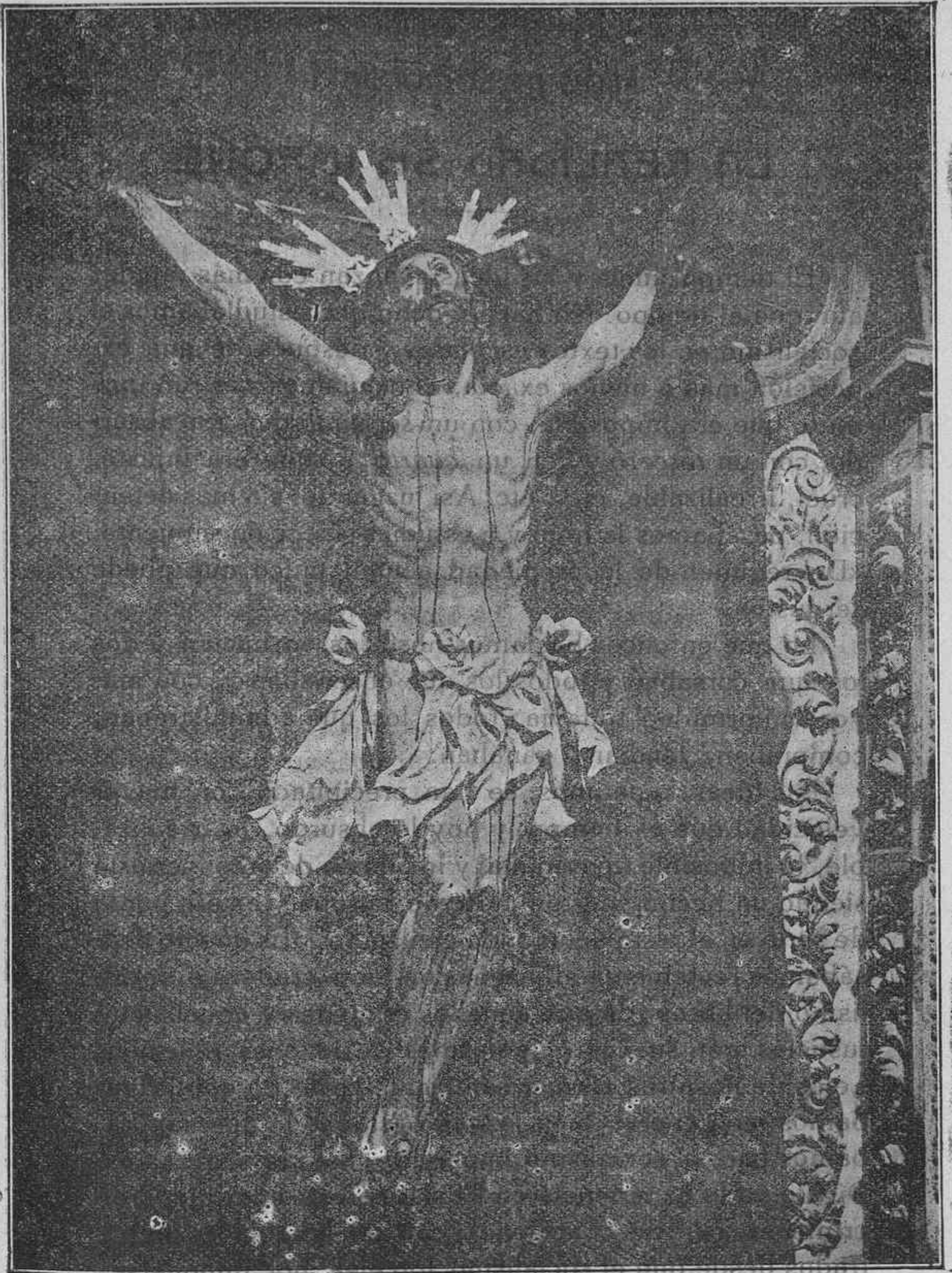
CRISTO DE LA EXPIRACIÓN (MONTAÑÉS)