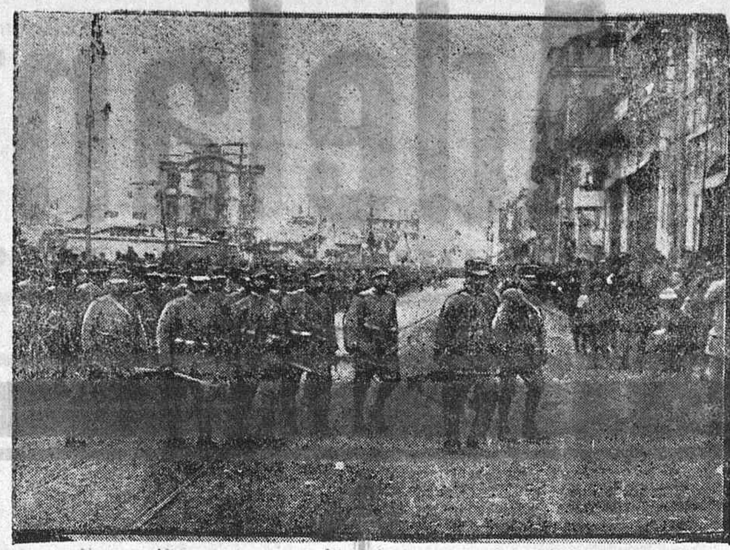
Notas gráficas de la guerra.—Llegada de tropas italianas en Salónica.