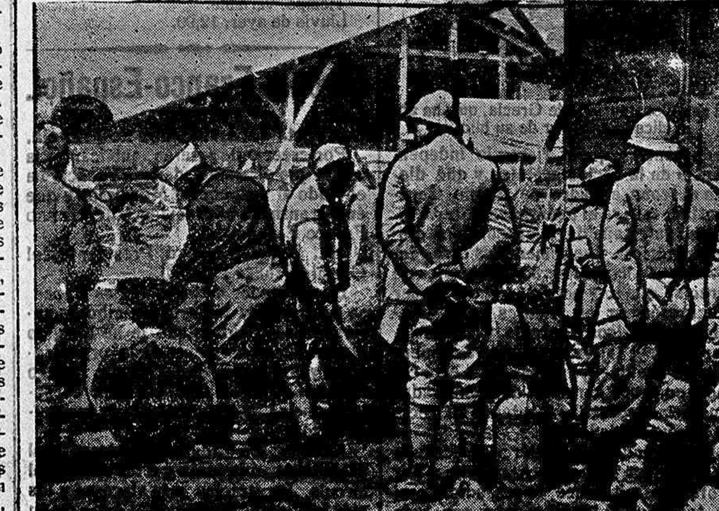
Notas gráficas de la guerra. Distribución de vino en las líneas avanzadas. (Foto-Información).

LANAS. Los importantes visos de depósitos de lanas, que pueben hacer sus propietarios obsequiosos en los Almacenes Generales, se proporcionalmente amplia las condiciones de crédito para esperar buenos tiempos de venta.