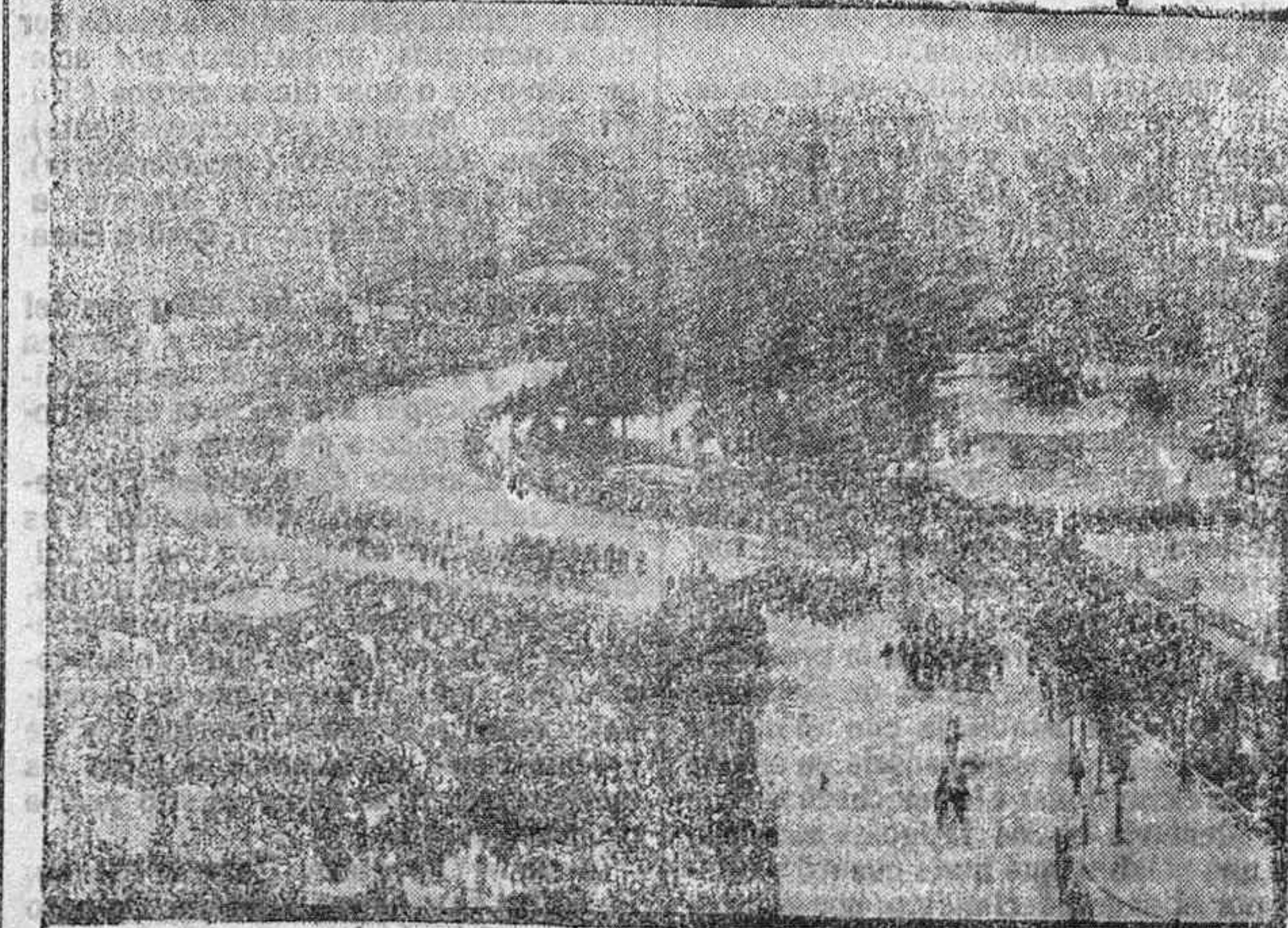
Notas gráficas de la guerra.-Fiesta de Julio en París. Vista en conjunto del desfile por la plaza de la Nación.