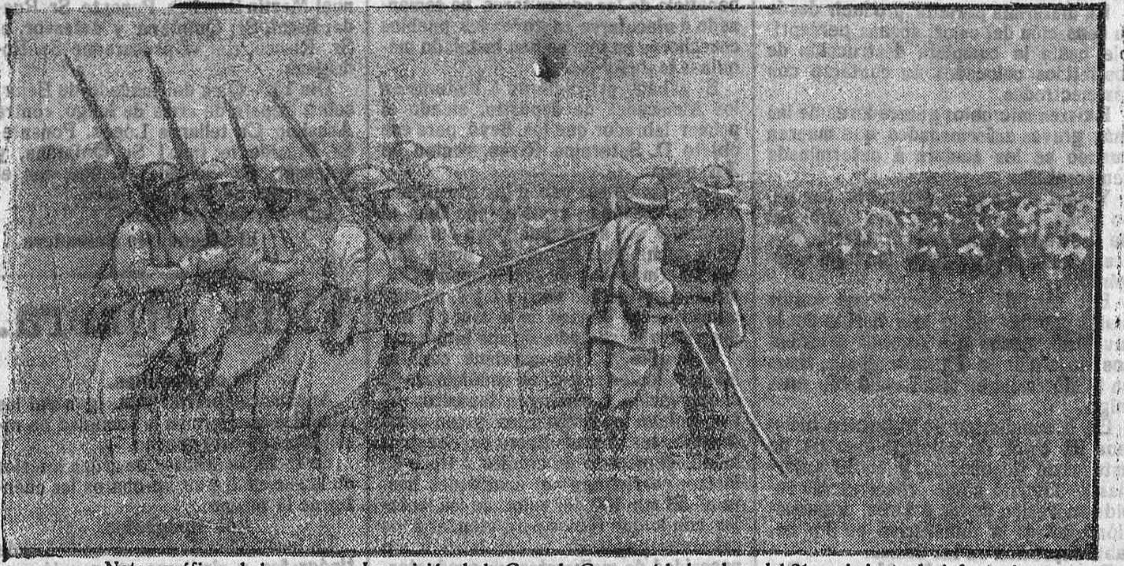
Notas gráficas de la guerra.—Imposición de la Cruz de Guerra á la bandera del 31 regimiento de infantería. (Foto-Información).

Círculo Franco-Español. Las fiestas del 14 de Julio. La comisión de espectáculo del Círculo Franco-Español continúa sus trabajos de organización de las fiestas que han de celebrarse con motivo del 14 de Julio, festividad nacional francesa.