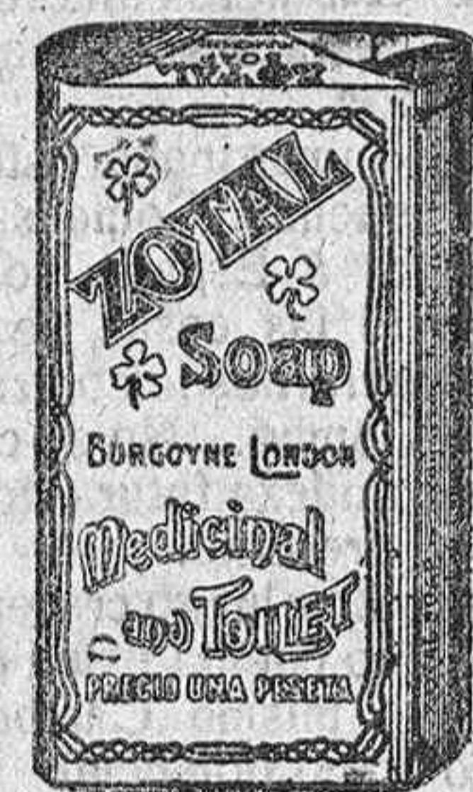
Envase del JABON ZOTAL

EL MEJOR DESINFECTANTE PARA LA HIGIENE - CURA LAS ENFERMEDADES DEL GANADO, VIÑAS, PLANTAS Y ARBOLES FRUTALES - INDISPENSABLE PARA COMBATIR LA LANGOSTA - CON SU