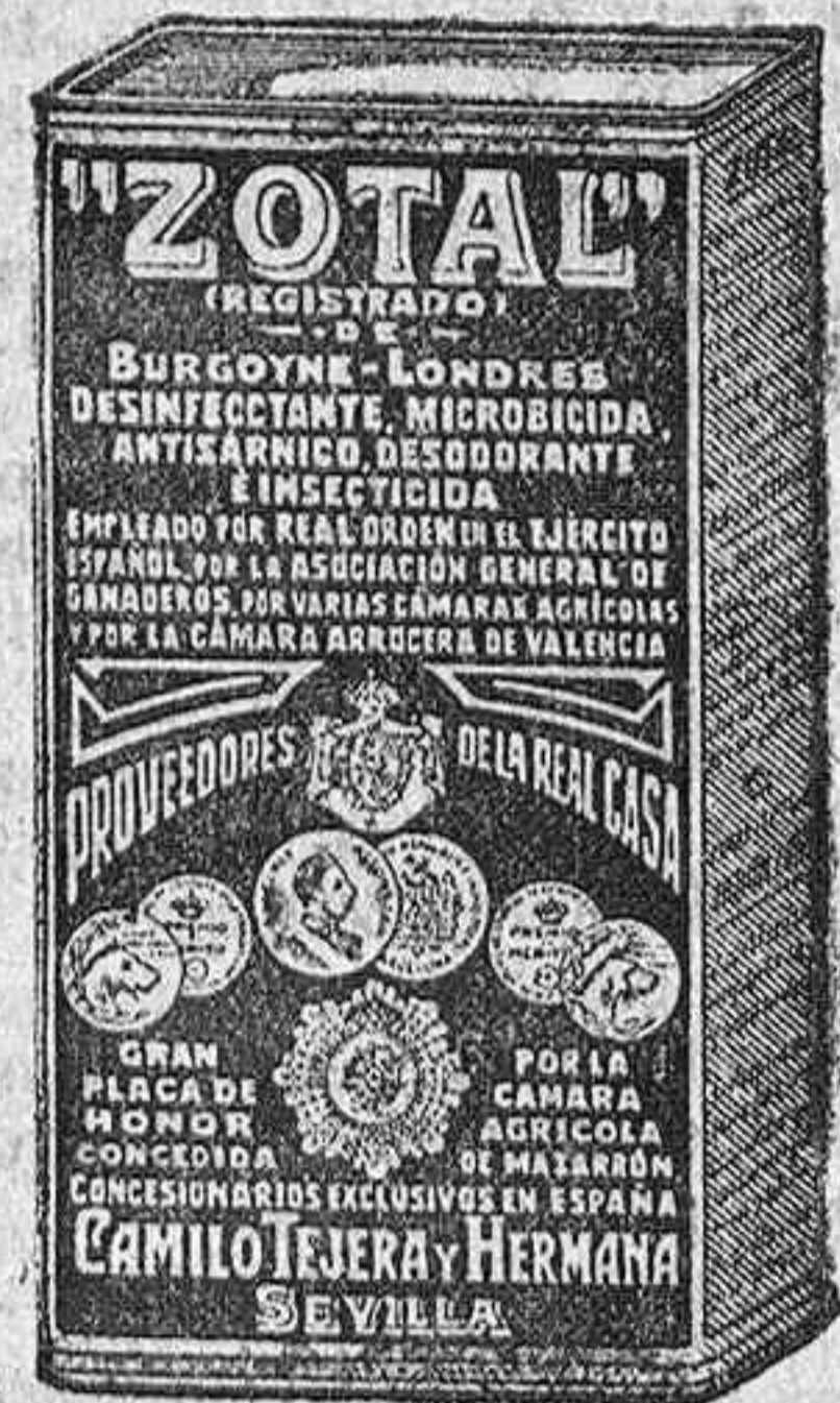
Nuevo envase del ZOTAL