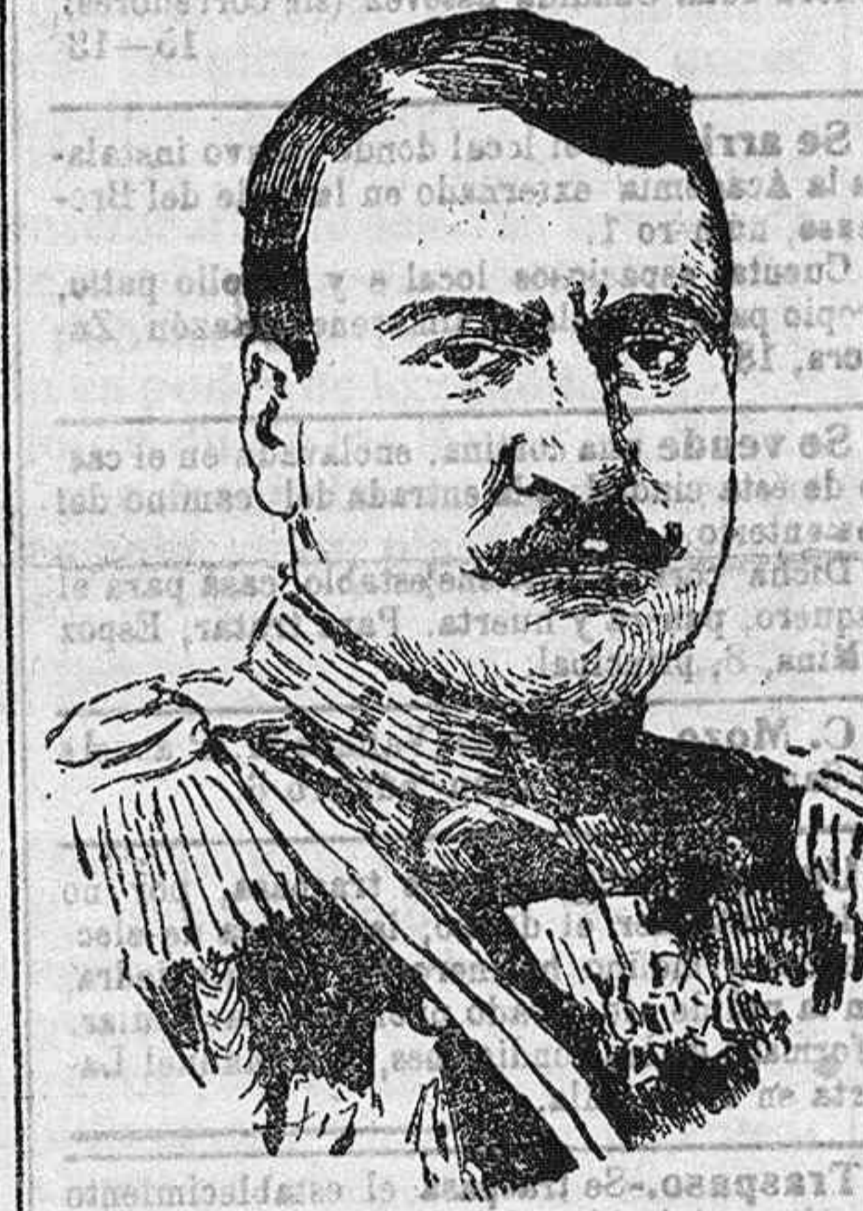
General búlgaro Dimitrieff, comandante en jefe del ejército ruso que opera en la Galitzia y asedia la plaza de Przemysl.