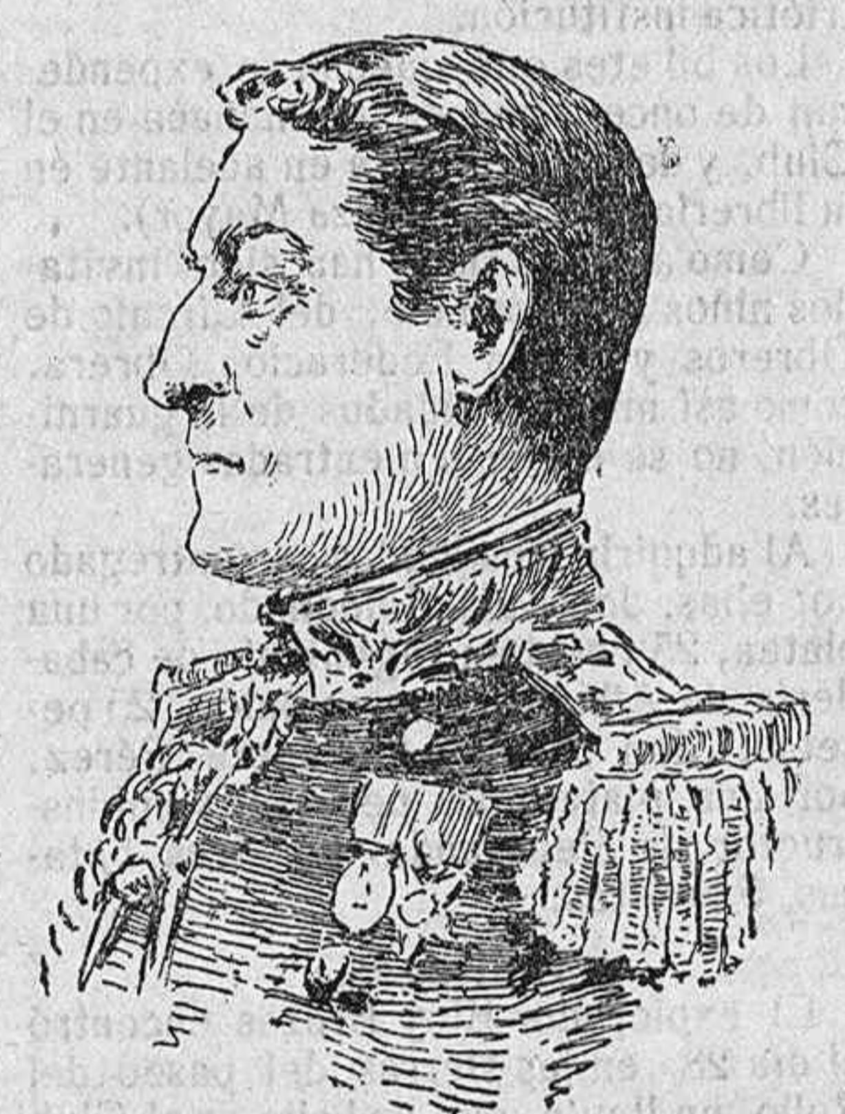
Almirante inglés Moore, tercer lord del Almirantazgo.