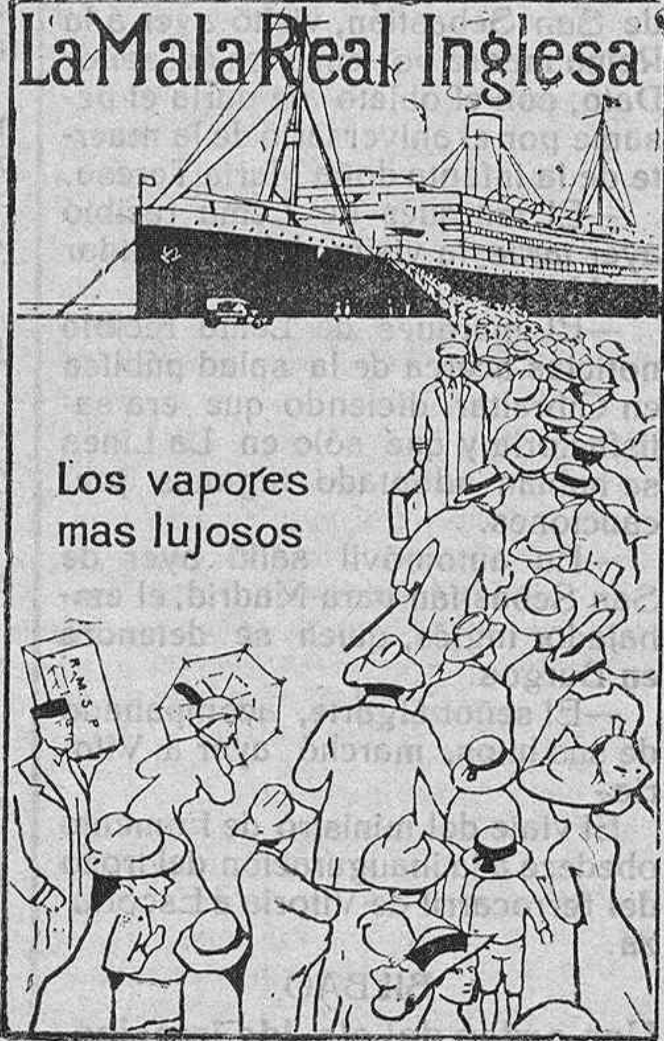
Los vapores mas lujosos

R. M. S. P. SERVICIO RAPIDO PARA PERNAMBUCO BAHIA RIO JANEIRO SANTOS MONTEVIDEO Y BUENOS AIRES