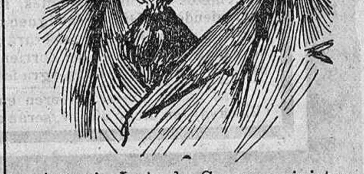
Antonio Luis de Gomes, ministro de Obras públicas del nuevo Gobierno portugués.

Artículo 3.º Continúa también en vigor como ley de la República portuguesa, el decreto de 28 de Mayo 1834 promulgado bajo el régimen monárquico representativo, el cual extinguió en Portugal Algarbe, dominios portugueses é islas adyacentes, todos los conventos, monasterios, colegios, hospicios y cualesquiera casa de religiosos de todas las Ordenes regulares, fuese cual fuese su denominación, instituto ó regla.