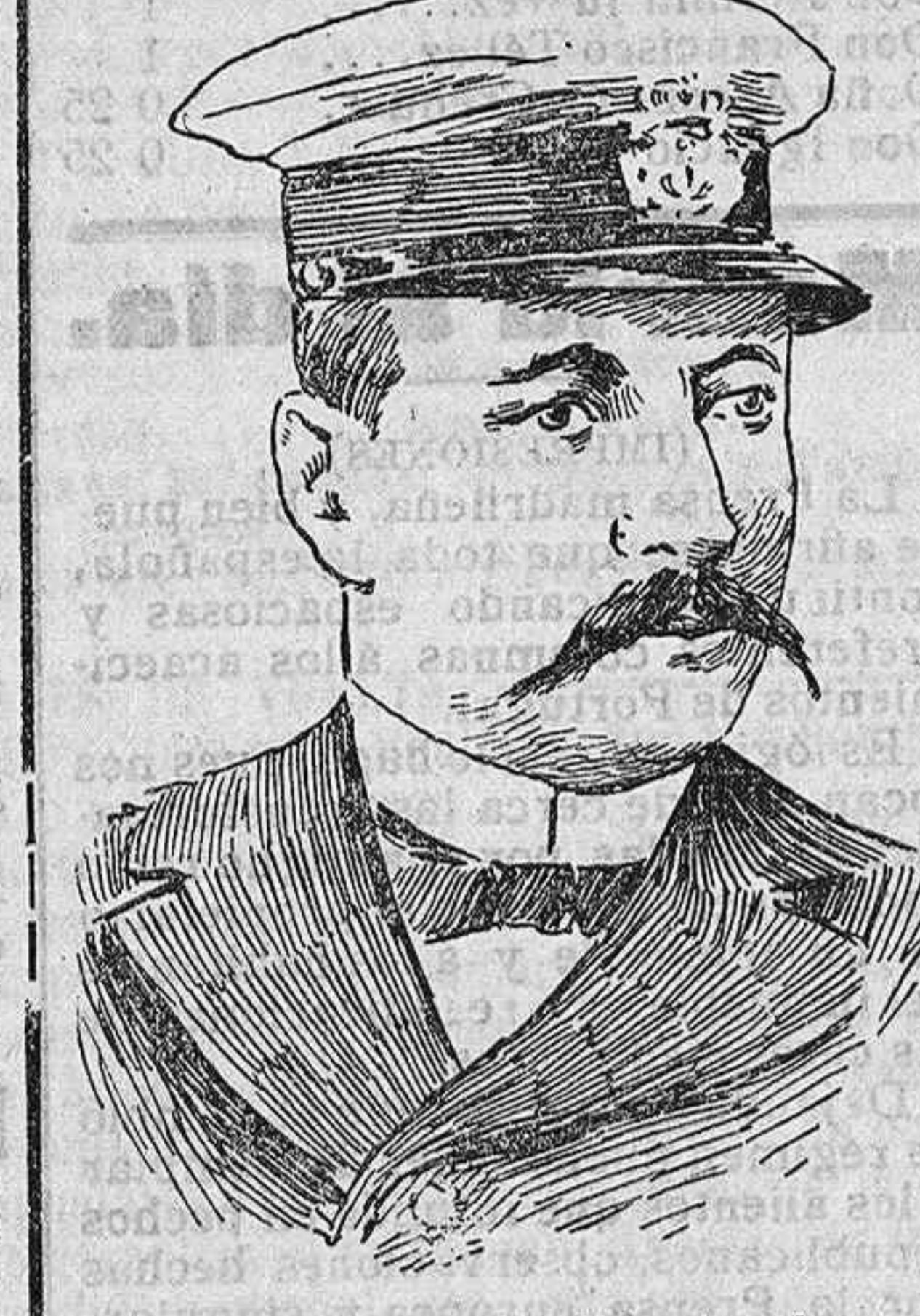
El vicealmirante Cândido dos Santos, quien después de sublevar a la escuadra surta en el Tajo, se suicidó por orrear venido el movimiento.

Demuéstrase con esto que la República ha venido a regir los destinos de Portugal con la aclamación del pueblo, cuyos sentimientos interpretan las elevadas personalidades que hoy gobiernan, al promulgar leyes de índole tan radical que en Francia originaron una tremenda conmoción y en España nos arrastraban casi de seguro a las lindes de una guerra civil.