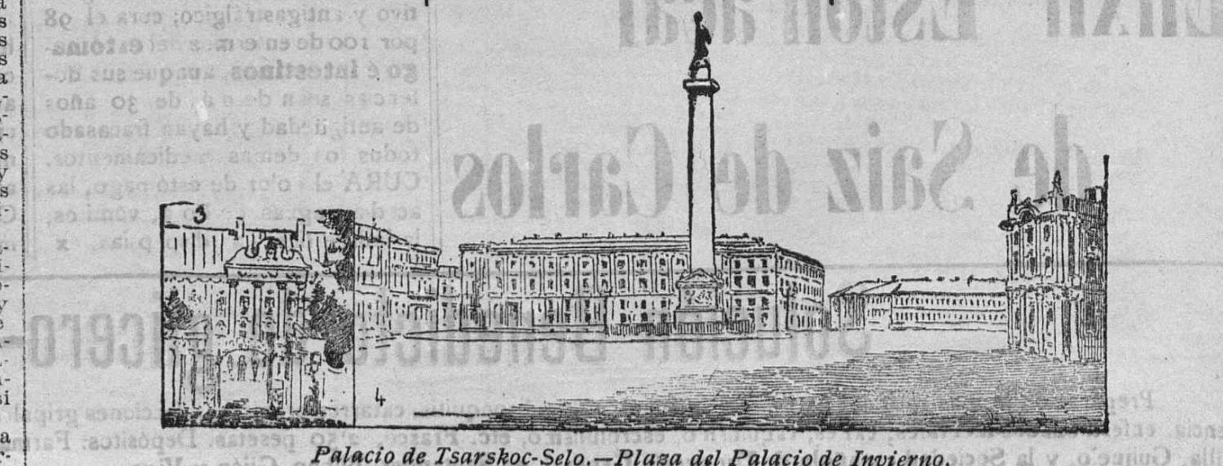
Palacio de Tsarskoc-Selo.—Plaza del Palacio de Invierno.