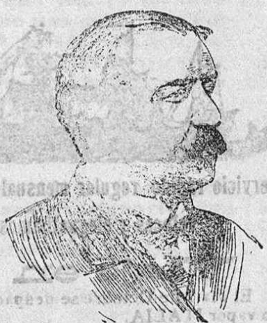
Ruiz Valarín, fiscal del Supremo

Mucho nos satisface oír de labios de tan elevado juriscónsul concepto tan terminantemente afirmado y halagador en extremo para quienes uno y otro día contribuimos con nuestro grano de arena, con las pobres cuartillas donde vertemos nuestras ideas tratando de reflejar principios y orientaciones, á la poderosa mole intelectual que constituye en las sociedades modernas la prensa nacional.