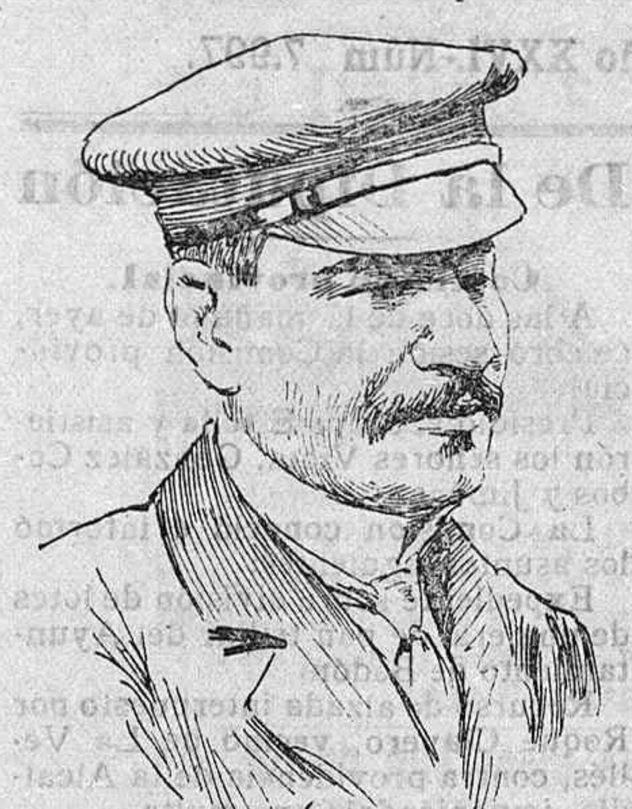
El general Hermes da Fonseca, nuevo presidente del Brasil.

Los que conocen las cualidades que como gobernante posee Hermes da Fonseca, afirman que su cu-