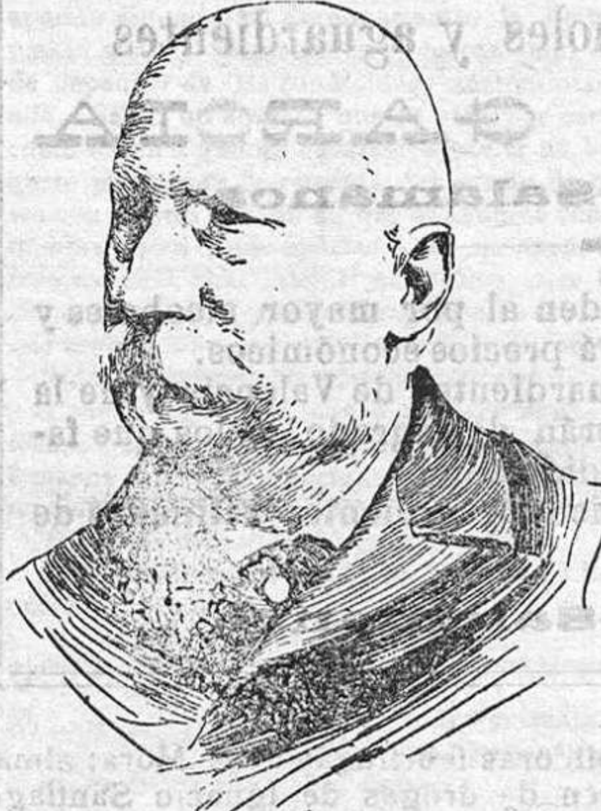
D. Manuel del Palacio Ilustre literato fallecido ayer en Madrid (Nació el 24 de Diciembre de 1832).