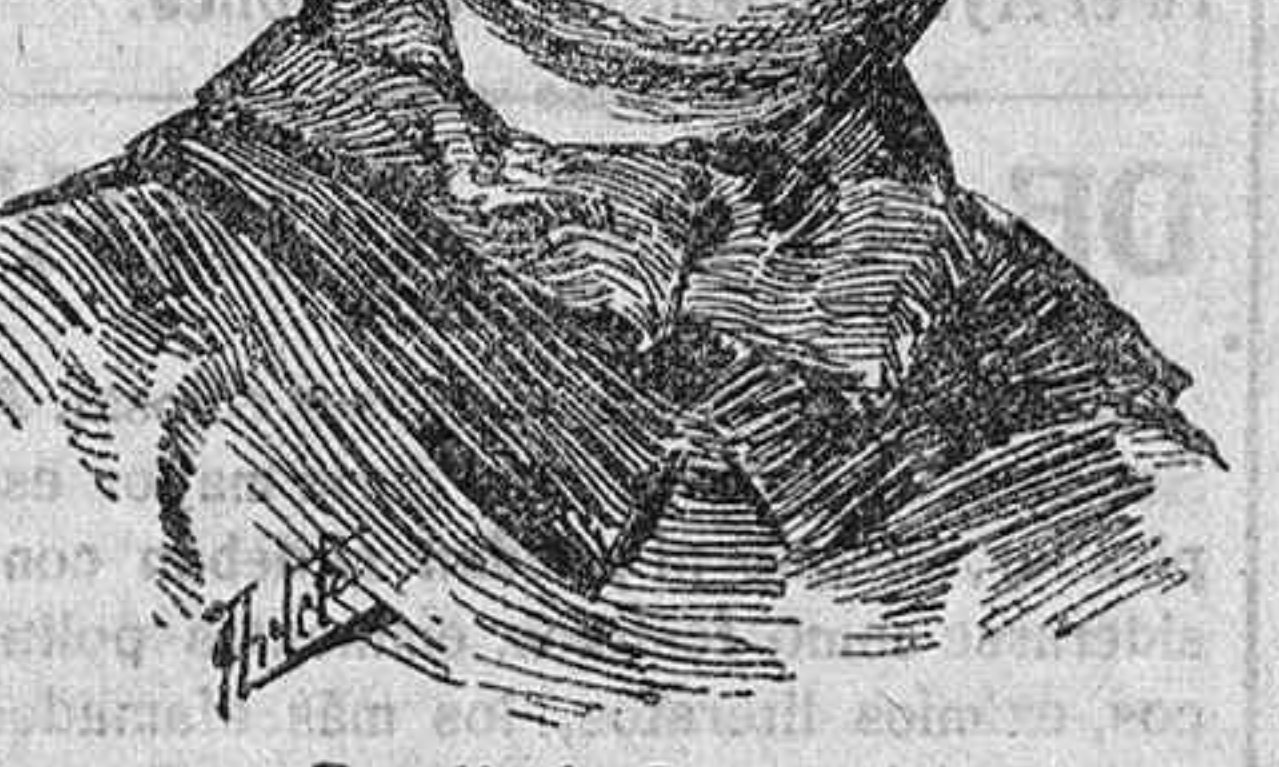
Rosalía de Castro.

Era la ilustre poetisa artista por temperamento y vocación, y para exponer sus altos pensamientos no precisaba cometerse á regla de métrica, sino que de su propia imaginación brotaban las fi-