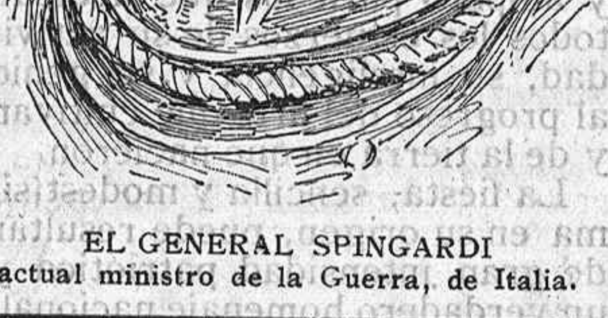
EL GENERAL SPINGARDI actual ministro de la Guerra, de Italia.