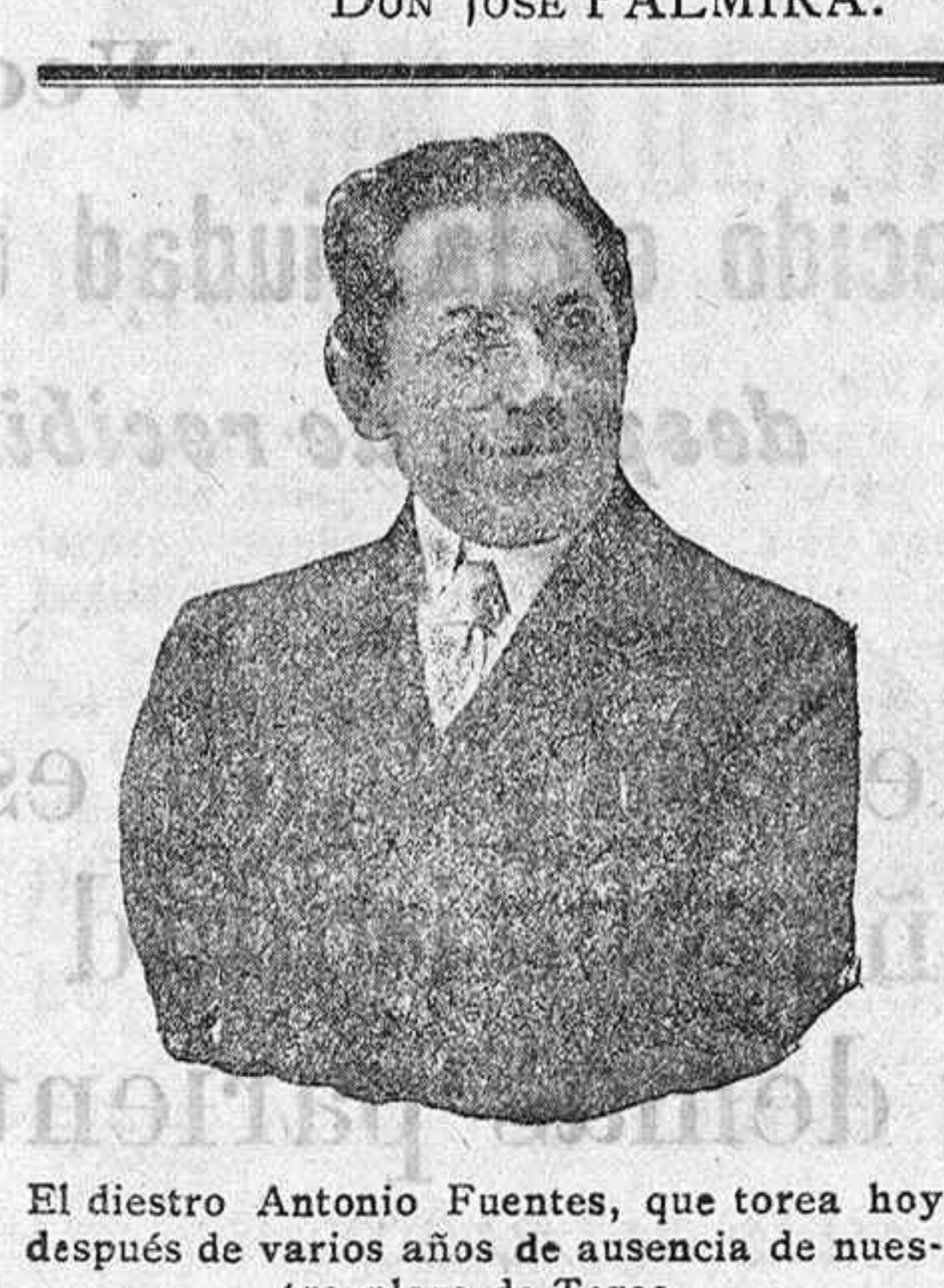
El diestro Antonio Fuentes, que torea hoy después de varios años de ausencia de nuestra plaza de Toros.

yo te diría: ¡Que el cielo te conserve la puntería! Quinto. Mancheguito de alias, negro, zaino. Sigue el chaparrón con toda su cohorte de relámpagos y truenos. El público, que hasta entonces ha aguantado la lluvia en los tendidos á pie firme, huye á la desbandada á guarecerse en gradas y palcos, desde donde presencia la lidia del quinto, que sale bastante avispadillo. ¡Acude bien á las varas; toma las que buenamente se le pueden colocar y tras un sólo par de banderillas, cuando ya humanamente no es posible que las cuadrillas continúen en el ruedo, Machaco empapado hasta los huesos, hace una hombrada. Coge la muleta con valentía rayana en la temeridad, sin temor á los elementos desencadenados, da dos pases al toro y se arranca con una buena estocada. Lo acaba de un descabello relámpago. ¡Bien por el niño de las de González! Yo te propongo al ministro de Marina para la cruz del Mérito Naval. ¡Bien merecida la tienes! Sexto. El sexto volverá de los corrales á pastar con los otros animales. Los toros de Parladé fueron bravos, nobles y de poder. Mataron ocho caballos. De los banderilleros, Morenito de Valencia y Camaró. De los de la mona, puso el mingo el Artillero con la vara del tercer toro, que resultó lapidaria. DON JOSÉ PALMIRA.