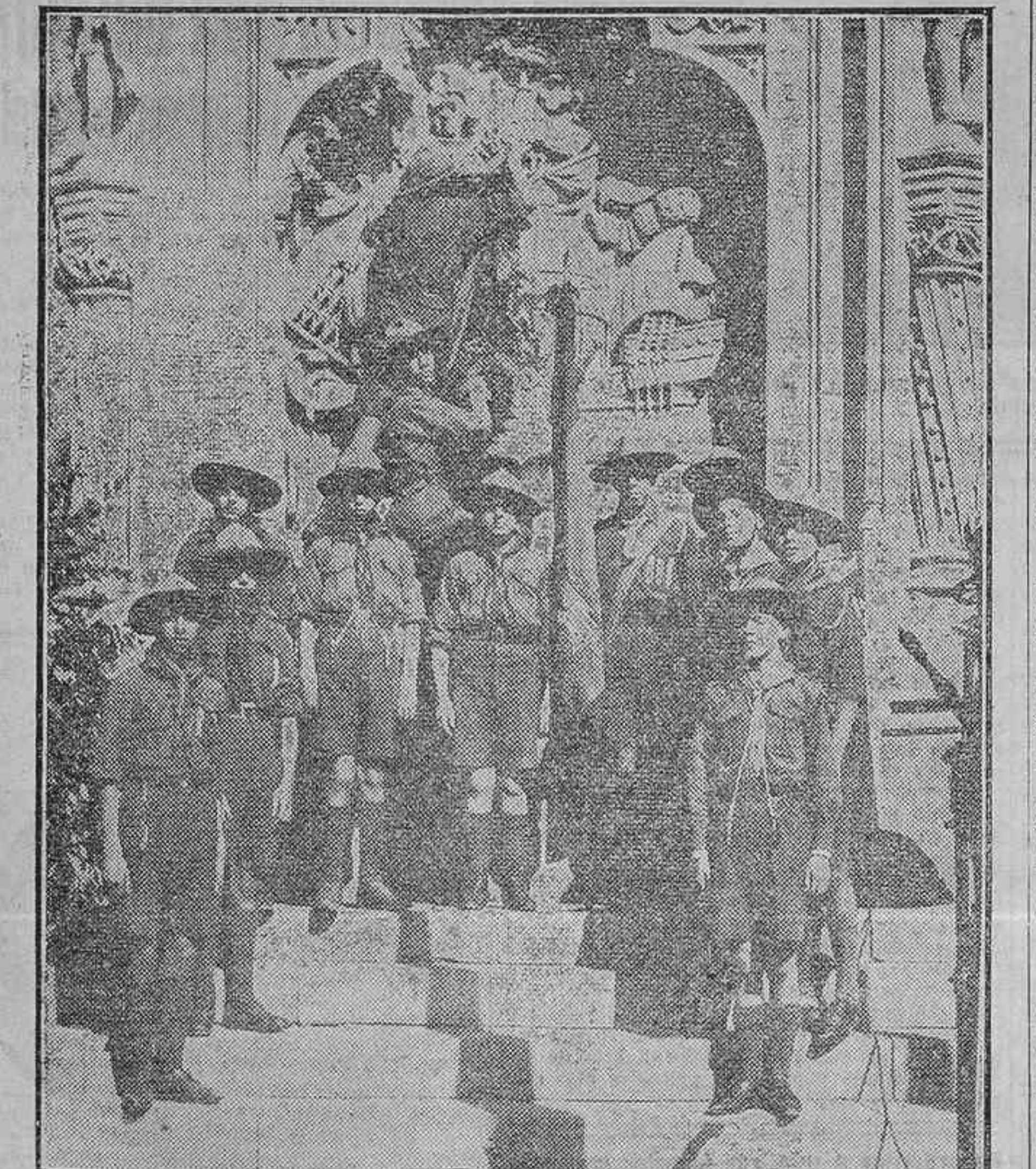
LA FIESTA DE LA RAZA.—LOS EXPLORADORES MADRILEÑOS DEPOSITANDO FLORES AL PIE DEL MONUMENTO DE COLÓN