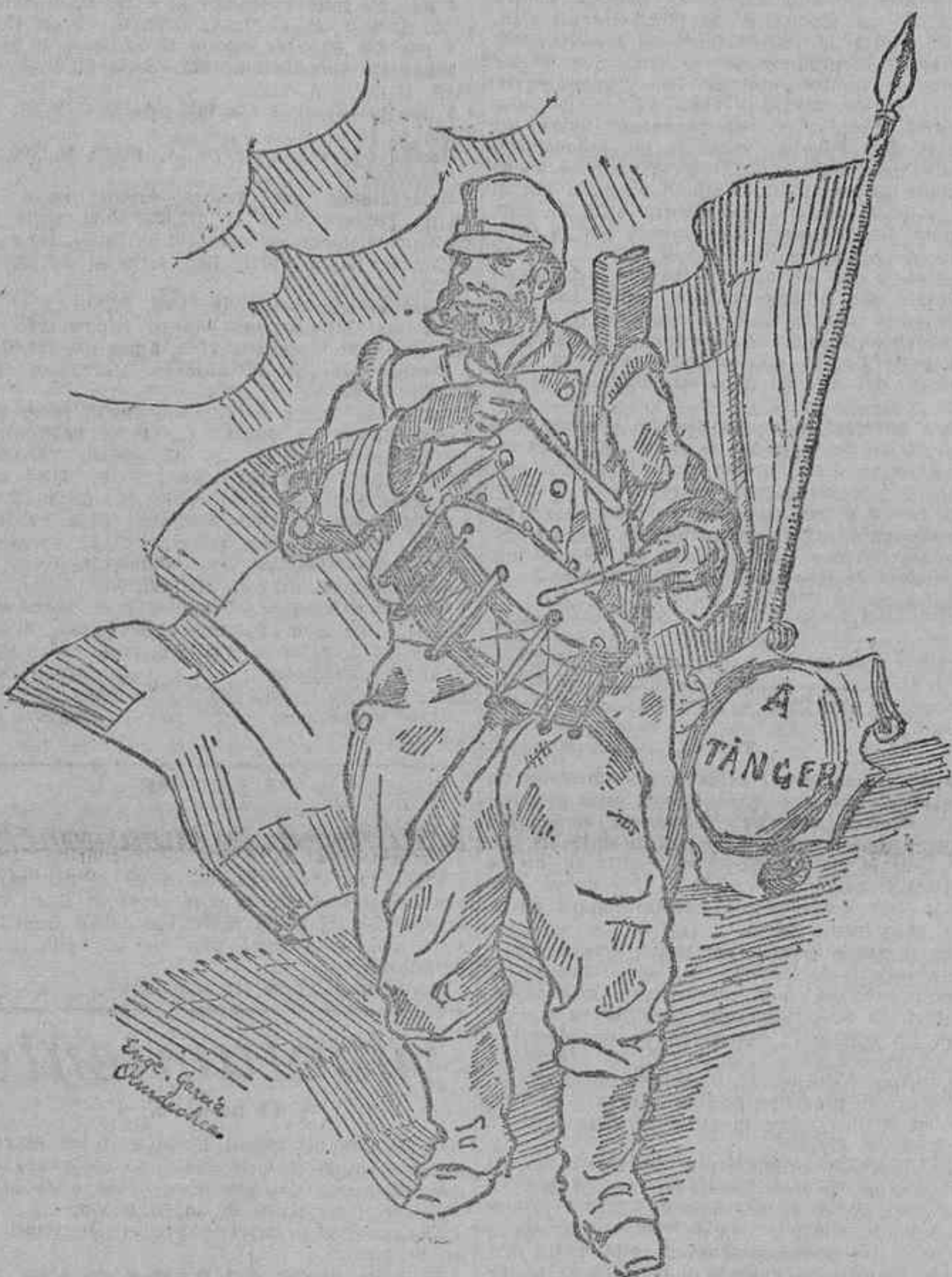
(Estampa de Enrique Garcia Ormaechea)

Para matar africanos. -- Y estrarán nuestras manos a Mahoma y al sultán. -- Conquista tras de conquista nuestro fustil triunfara. -- Y aunque Muhey nos resista nos lo traeremos acá.