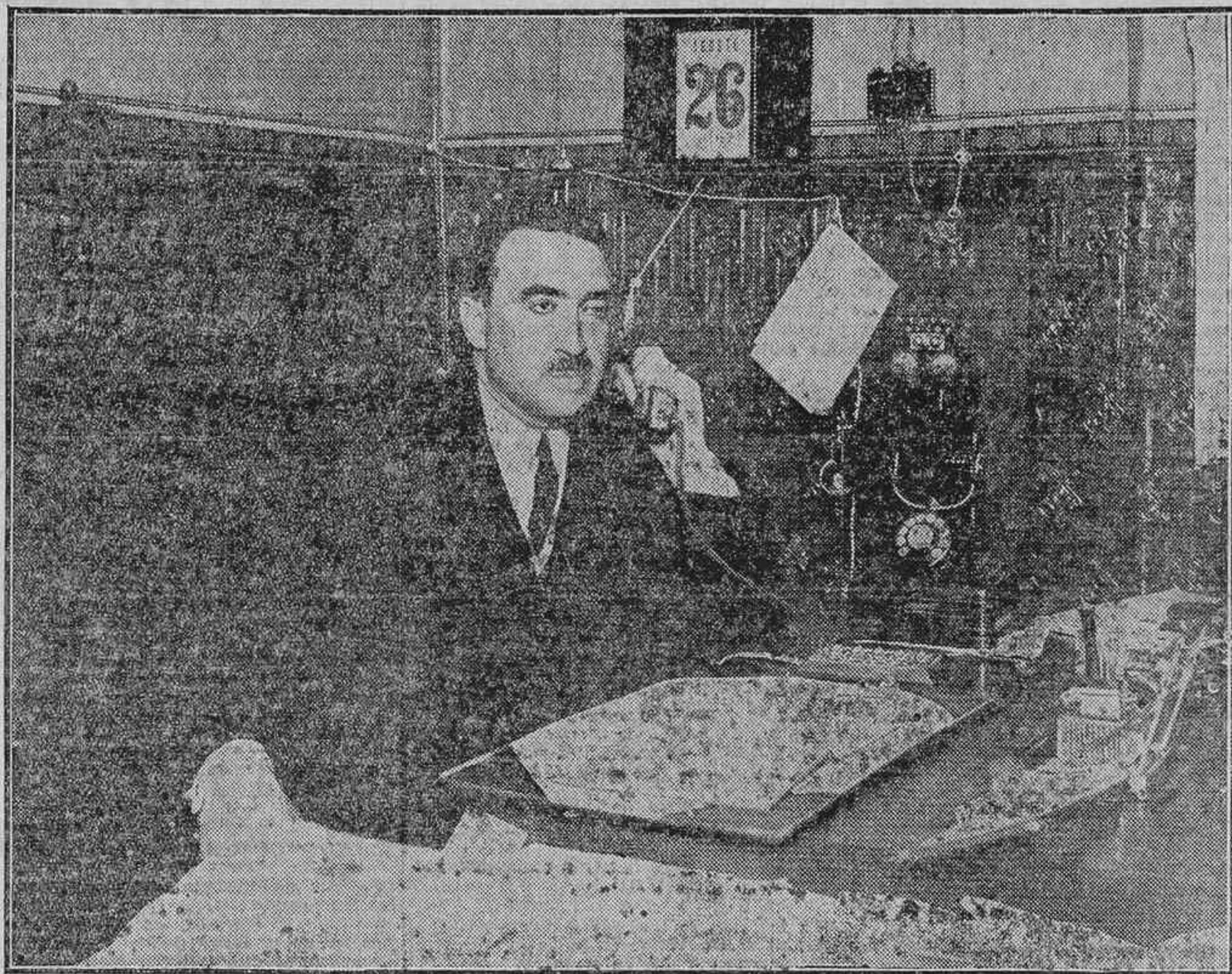
LA PRIMERA AUTORIDAD CIVIL DE SANTANDER HACIENDO LA PRUEBA EN SU DESPACHO OFICIAL DEL TELEFONO AUTOMATICO