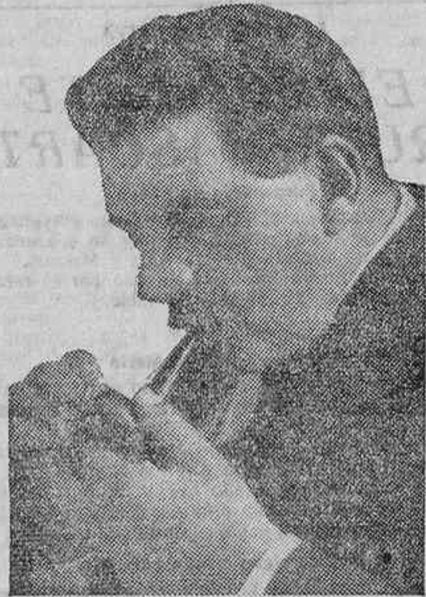
M. Edouard Herriot, radical socialista, nuevo ministro de Instrucción pública

Paris, 23. (Por teléfono).—El nuevo Gobierno ha quedado constituido en la siguiente forma: Presidencia del Consejo, Hacienda y Regiones