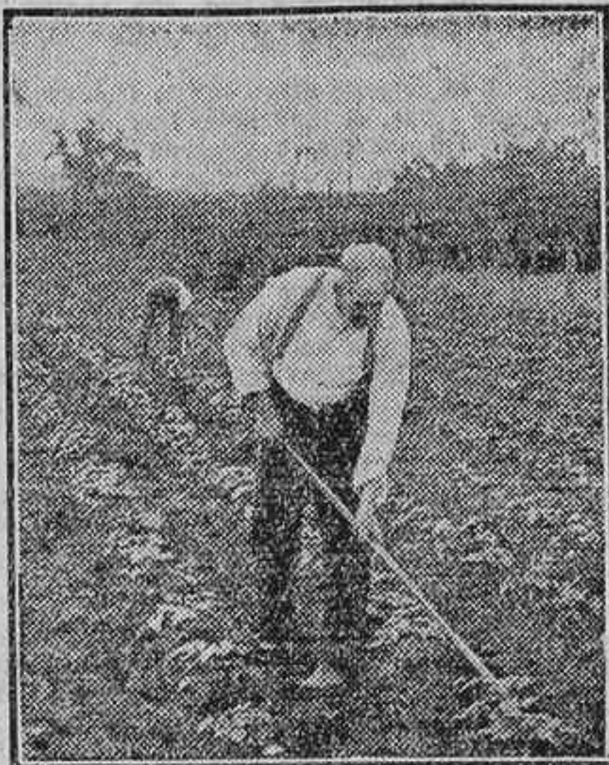
Labrando una siembra de judías

Los «medicos del campo» tienen ciertamente donde lucirse.