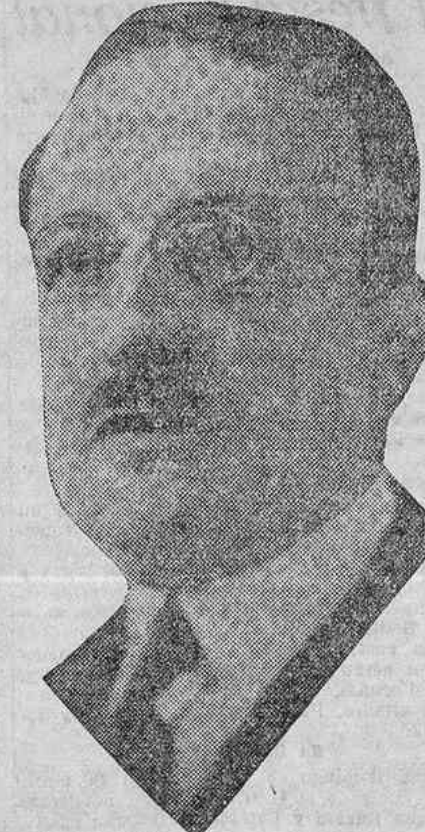
M. André Tardieu, independiente de la derecha, nuevo ministro de Obras públicas

Al disponerse a partir el buque, el contralmirante Orsini pronunció en la plataforma de la escala un discurso, agradeciendo las atenciones de que han sido objeto.