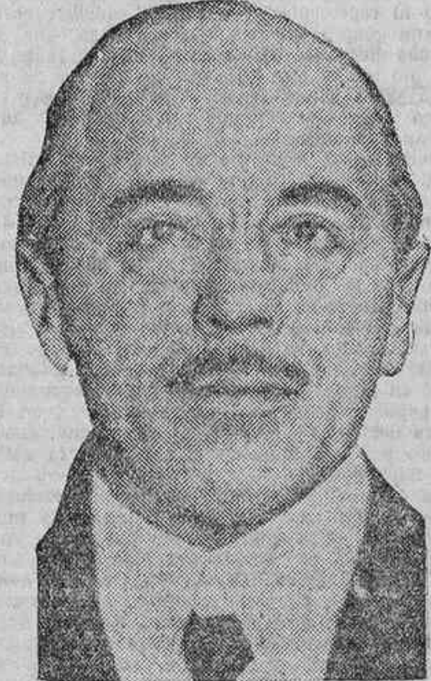
M. Albert Sarraut, radical socialista, nuevo ministro del Interior

manecido hoy estacionada varias horas ante el Elíseo, en espera de conocer la noticia de que el Sr. Poincaré había conseguido constituir Gobierno.