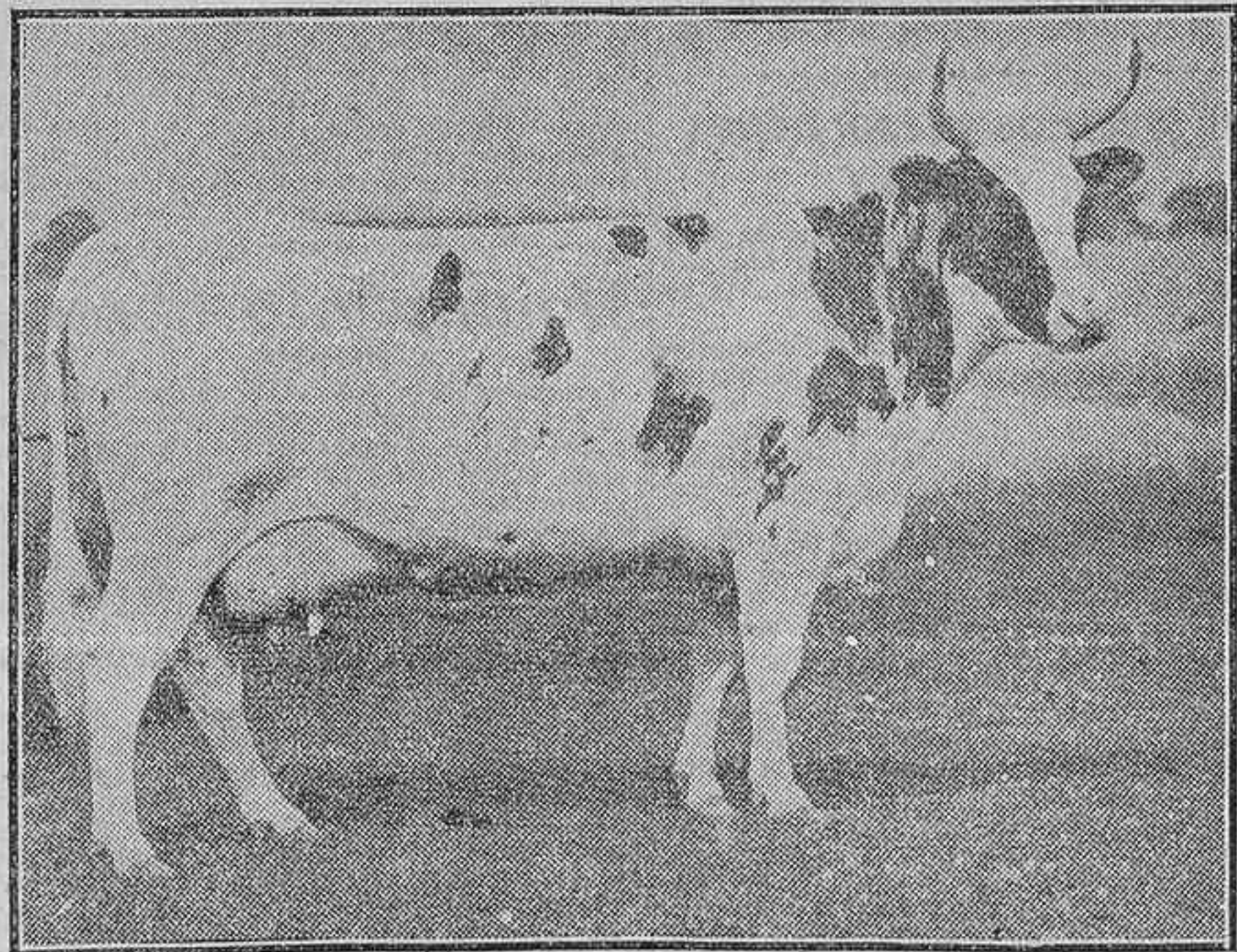
LAS BUENAS RAZAS EXTRANJERAS.—UNA HERMOSA VACA DE RAZA «AYRSHIRE», LAS QUE UNEN A LA CANTIDAD UNA EXCEPCIONAL CALIDAD DE LA LECHE

El Nitrato de Chile, empleado en cantidad de treinta o cuarenta gramos por metro cuadrado, en plantas de huerta, produce efectos verdaderamente maravillosos.