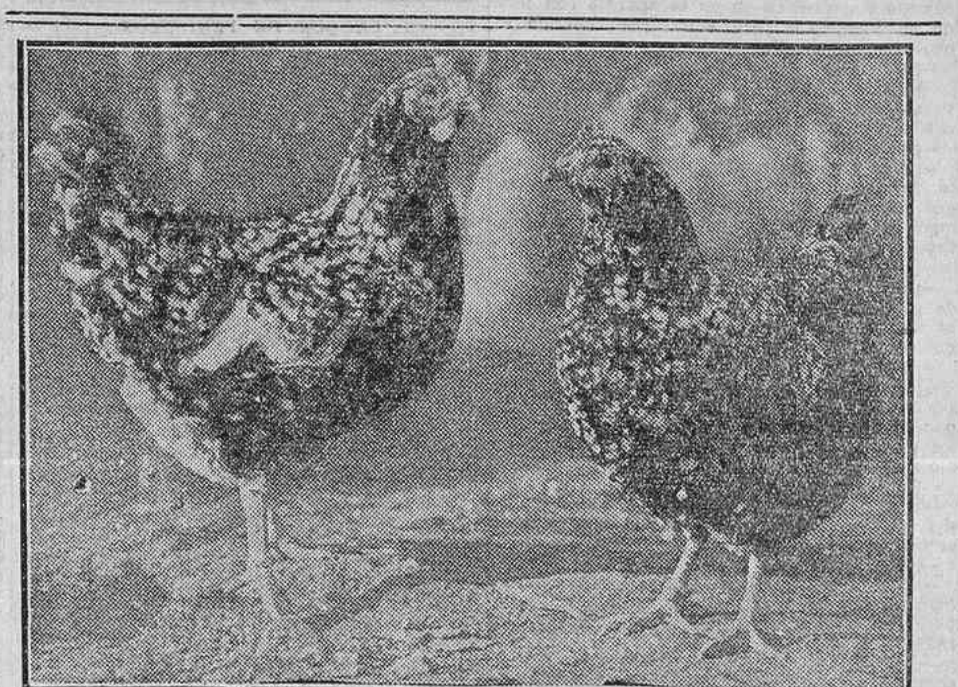
RE AVICULTURA.—DOS GALLINAS DE RAZA ORPINGTONS