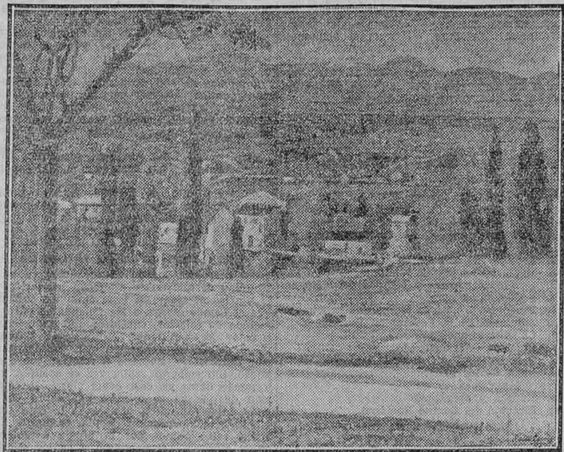
EXPOSICION NACIONAL DE BELLAS ARTES.—«PAISAJE DE LA DEHESA», POR RAFAEL CORTÉS

Santiago Bonome, uno de los más fuertes temperamentos artísticos de Galicia, el que tal vez interprete mejor las ansias, las virtudes, la psicología del pueblo gallego, viene a