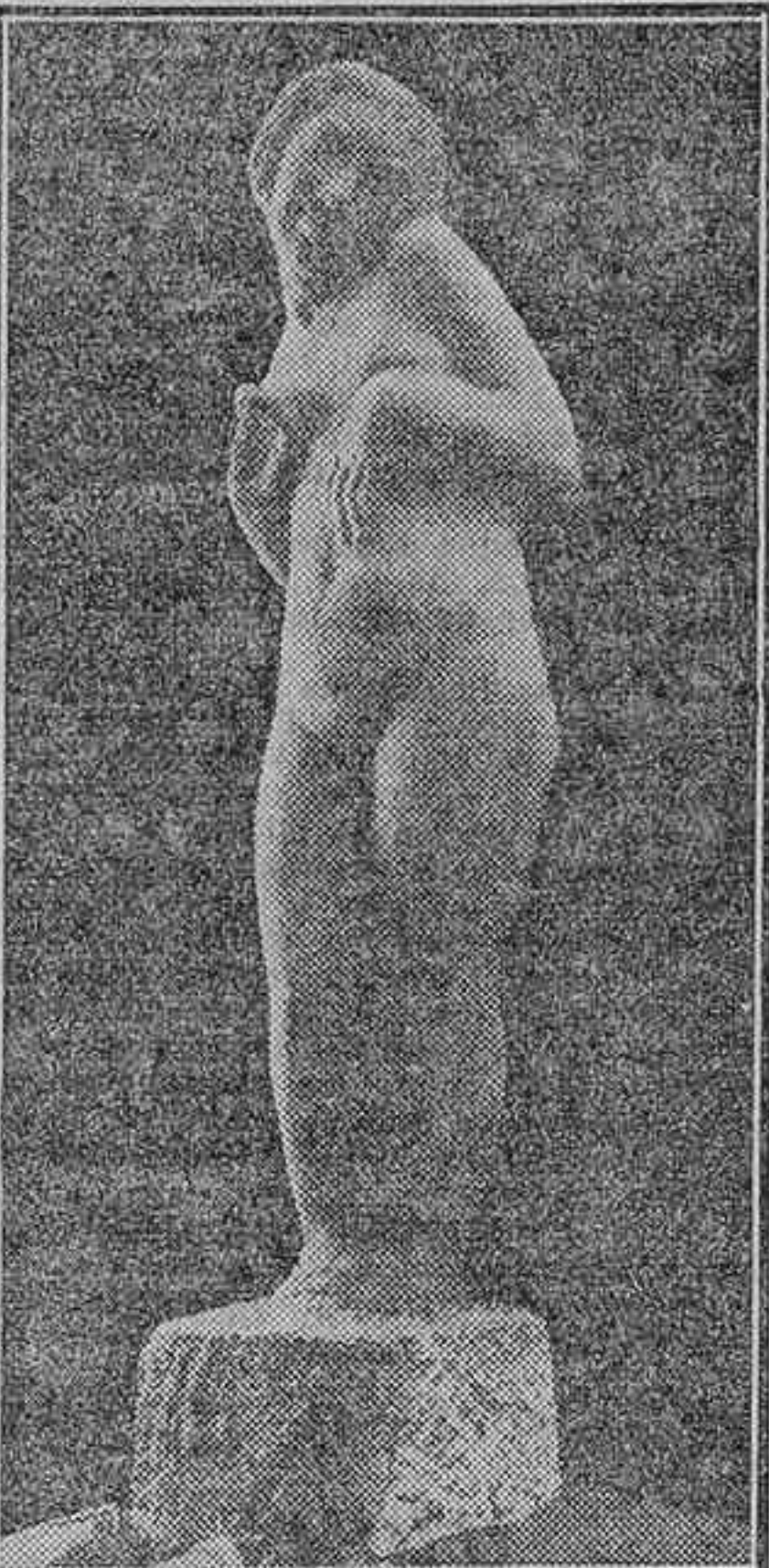
Exposición Nacional de Bellas Artes.—«Bellísimo desnudo de muchacha en piedra, para fuente o jardín, estatua del ilustre escultor Emiliano Barral, que «no ha obtenido recompensa alguna»

la Exposición con dos tablas en cocha: «Fidalgos» y «Recordo», que son algo que bastaría para calificar de portentoso a un artista. Fuerte, decidida, de vigorosa traza la talla, la escultura de Bonome impresiona y a veces sobrecoge por el espíritu y la observación. En