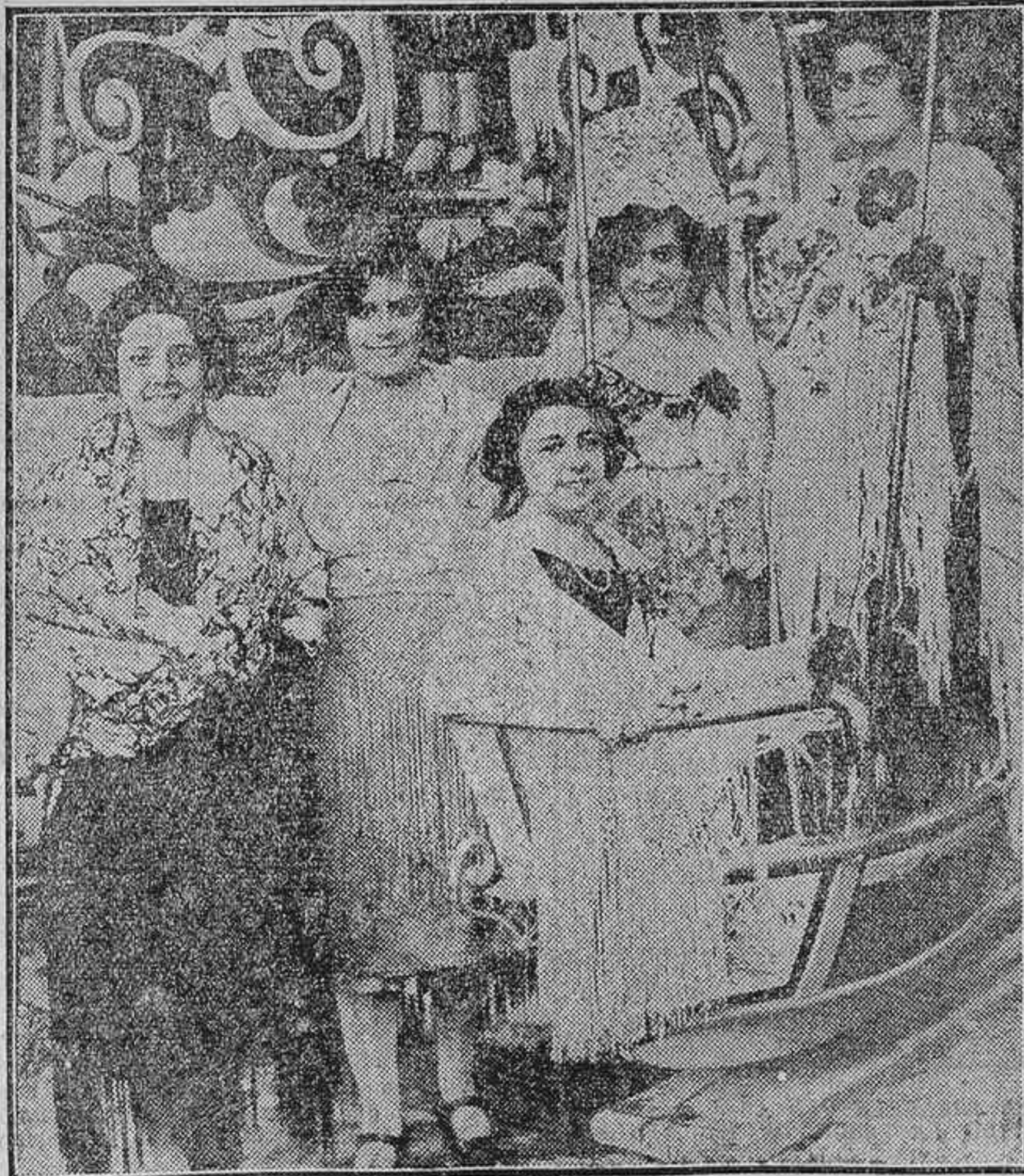
LO MEJOR DE LA VERBENA DE LA PRINCESA