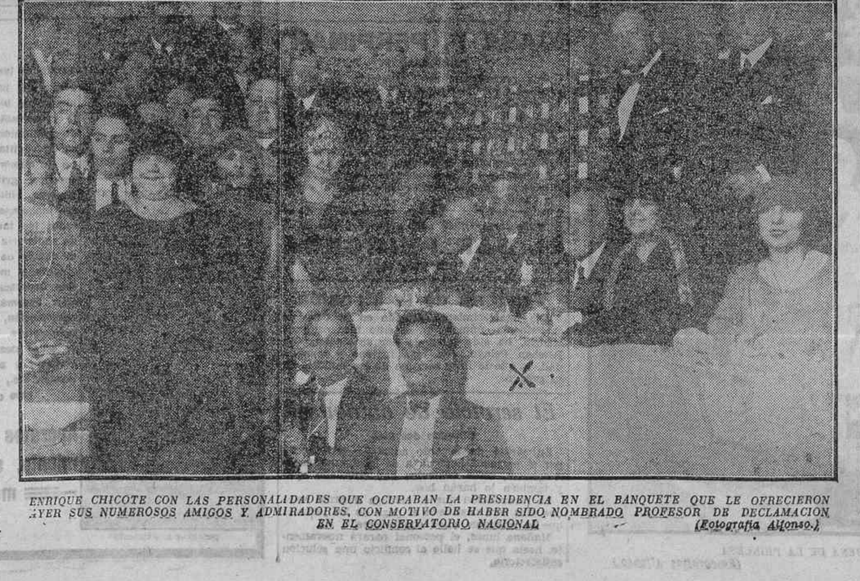
ENRIQUE CHICOTE CON LAS PERSONALIDADES QUE OCUPABAN LA PRESIDENCIA EN EL BANQUETE QUE LE OFRECIERON AYER SUS NUMEROSOS AMIGOS Y ADMIRADORES, CON MOTIVO DE HABER SIDO NOMBRADO PROFESOR DE DECLAMACION EN EL CONSERVATORIO NACIONAL

Aboga por unas Cortes que legislen eficazmente. —Es necesario—dice—mantener el sufragio universal, porque no es justo y ni siquiera posible retroceder al voto de clases, las cuales pueden estar representadas en el Senado del modo más apropiado a las necesidades actuales. Para llevar al Senado la representación justa de clases, no es necesario modificar la Constitución, porque el artículo 23 de la vigente ley permite cambiar las condiciones requeridas para ser senadores, por medio de una simple ley.