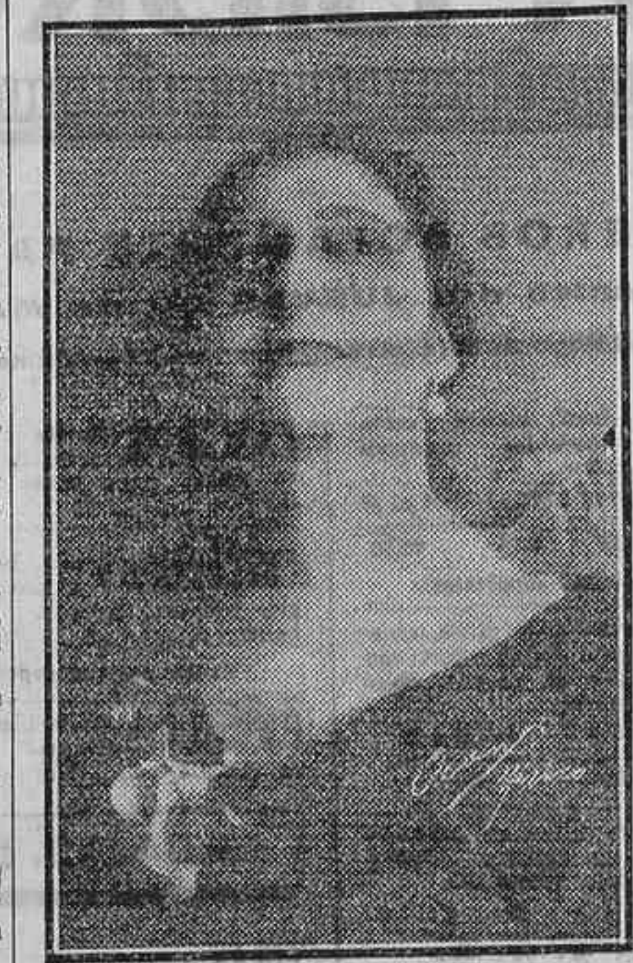
La gran actriz Lola Membrives

Lola Membrives, la admirable actriz—española, en el imperio del habla y del arte—, y, por su condición de argentina, la más alta gloria de la escena hispanoamericana, celebró anoche su beneficio. Esta solemnidad anuncia el próximo fin de su brillante temporada de este año en Lara. El "todo Madrid", gozoso de arte exquisito, llenó una vez más el teatro y dió a la insignie actriz testimonio entusiasta de su admiración