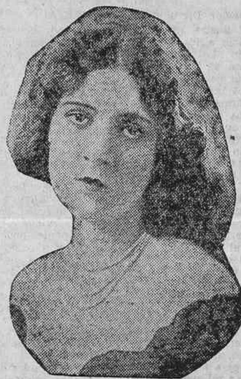
Olive Borden, premio de belleza en New York y estrella de la Fox-Film

Preferiríamos pecar de error en lo que tememos. ¡Allá veremos!