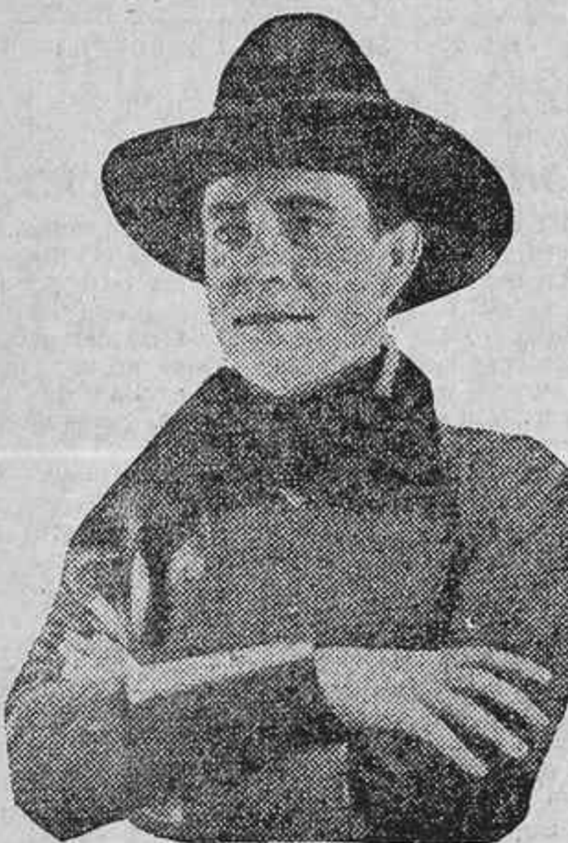
El célebre actor cinematográfico John Gilbert