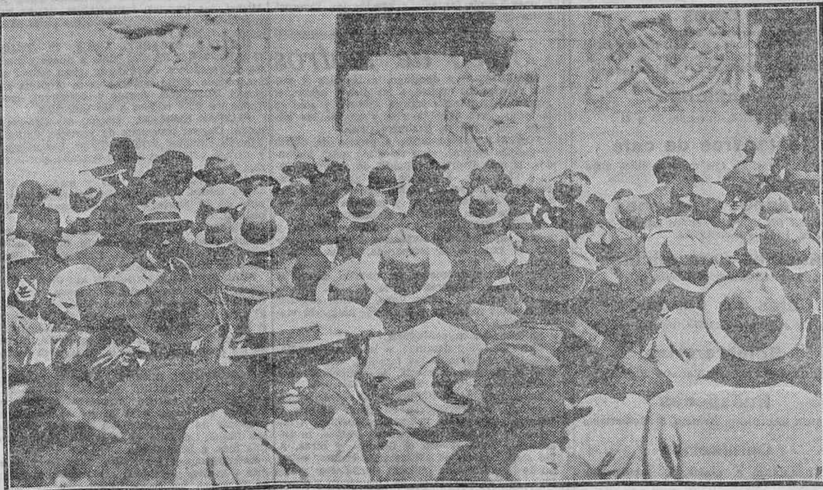
LA INAUGURACION DEL MONUMENTO A RAMON Y CAJAL.—LOS ESTUDIANTES EN EL ACTO INAUGURAL

Terminó con frases de franco optimismo. Don Alfonso descubrió el monumento y ante él desfilaron los niños de las escuelas, arrojando flores.