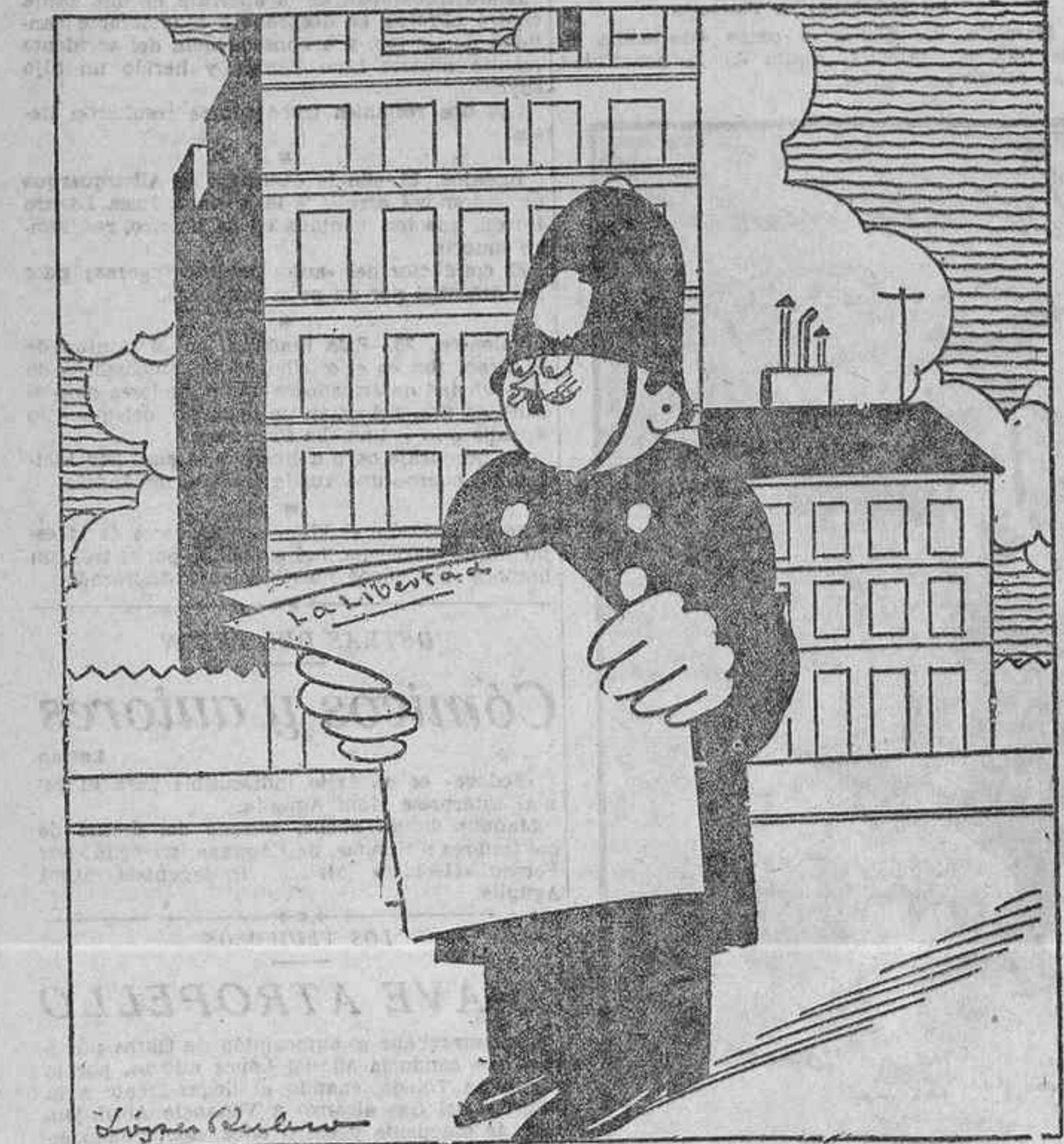
--¡Madrid-Manila, París-Tokio, Londres-Australia, Nueva York-París, Londres-El Cabol... No hay duda. Se impone el servicio aéreo de la porra.

Del primer reconocimiento, relativamente somero, practicado hasta ahora, parece deducirse que el esqueleto pertenecía a una persona, deduciéndose esto del examen de un hueso que parece una tibia y de otro que conserva exactamente la forma de un maxilar inferior humano.