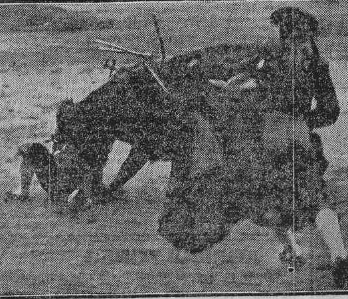
COGIDA DE FORTUNA CHICO