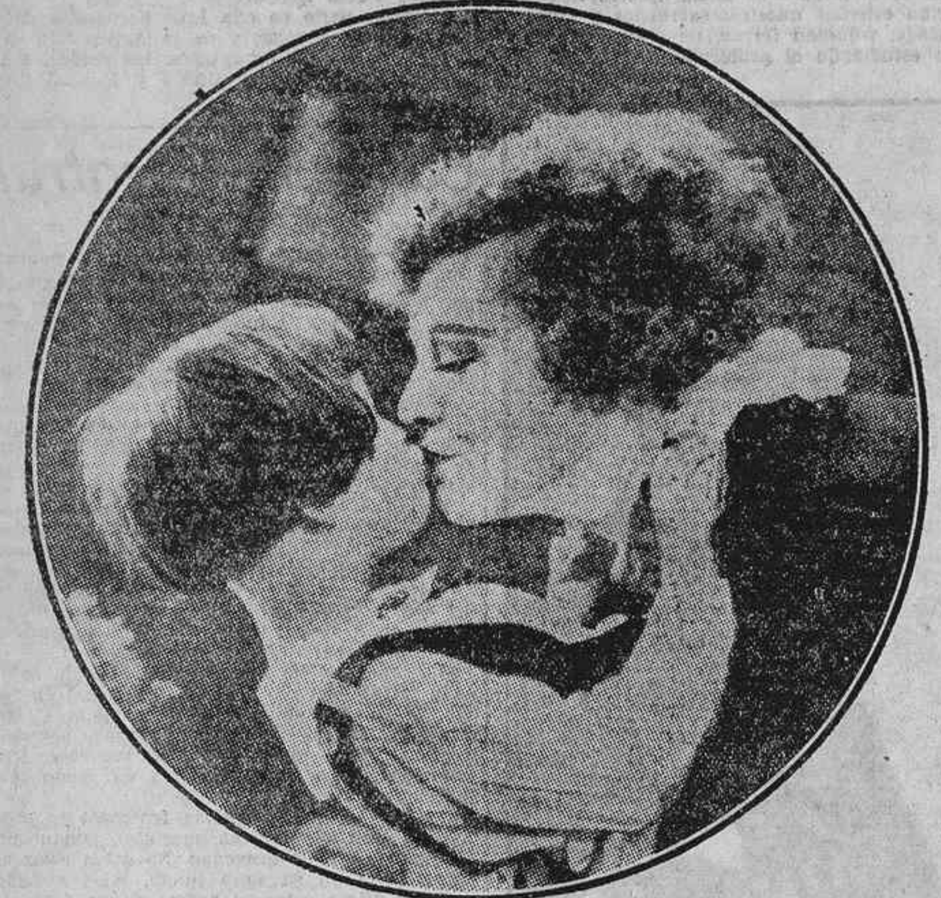
LA CELEBRE ESTRELLA AMERICANA ETHEL CLAYTON Y EL PRECOZ ARTISTA BABY MURIEL

Los números de plana cinematográfica se reparten gratis a todas las Empresas cinematográficas y Casas productoras y alquiladoras.