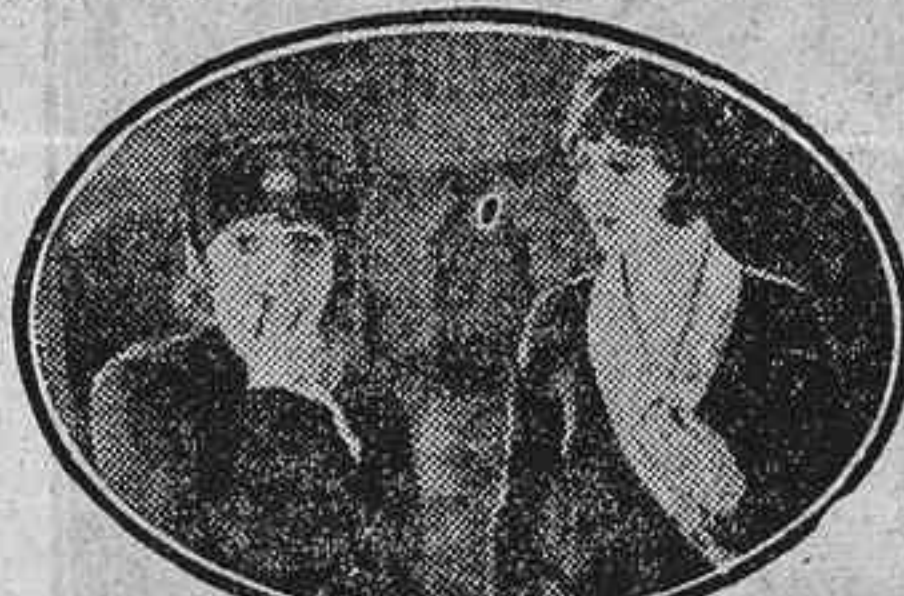
—Le gusto yo. —Y me mira a mí (Ooh...)

tal comenzada en Aragón, y en Madrid continuada firmemente.