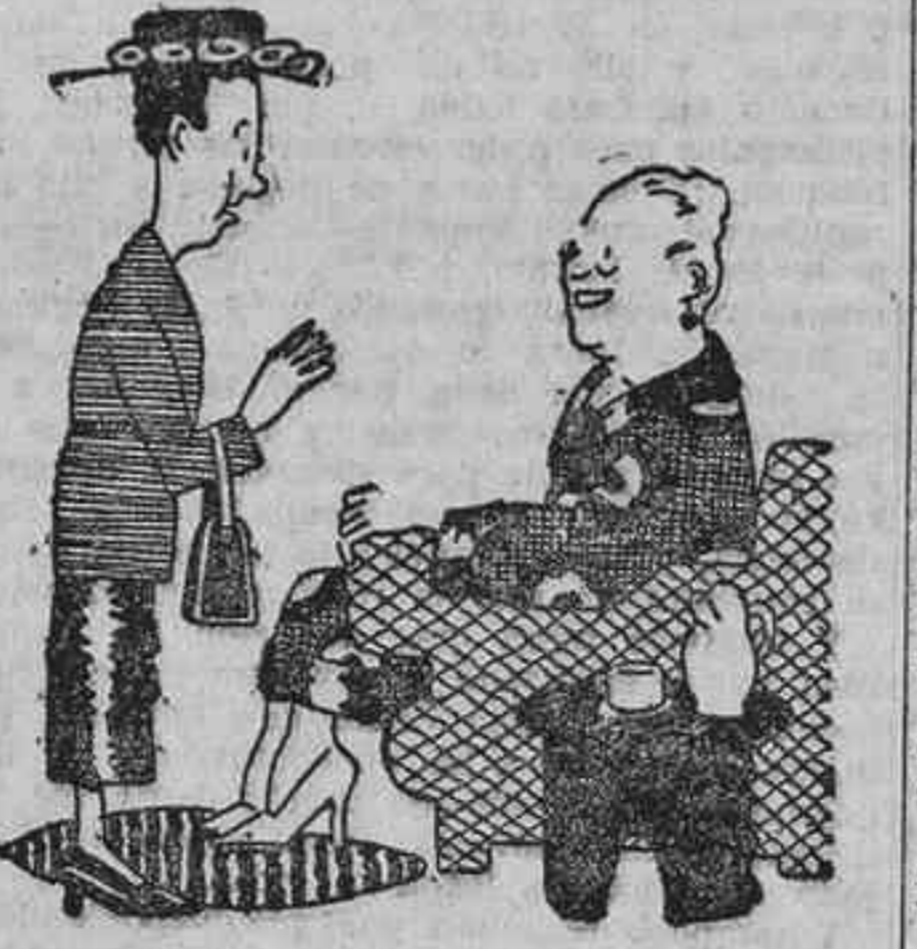
—Me gustaría que fuera cierto eso que usted dice de haber servido a una baronesa... —Se convencerá la señora si quiere verme la camisa. Todas las tengo con corona.