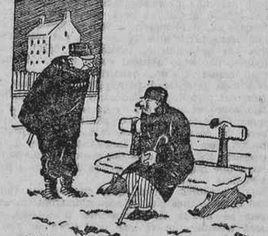
El guardia.—Pero, caballero, ¿qué espera usted para irse a su casa? —El deshielo, señor. La nieve se me ha caído en la nieve.