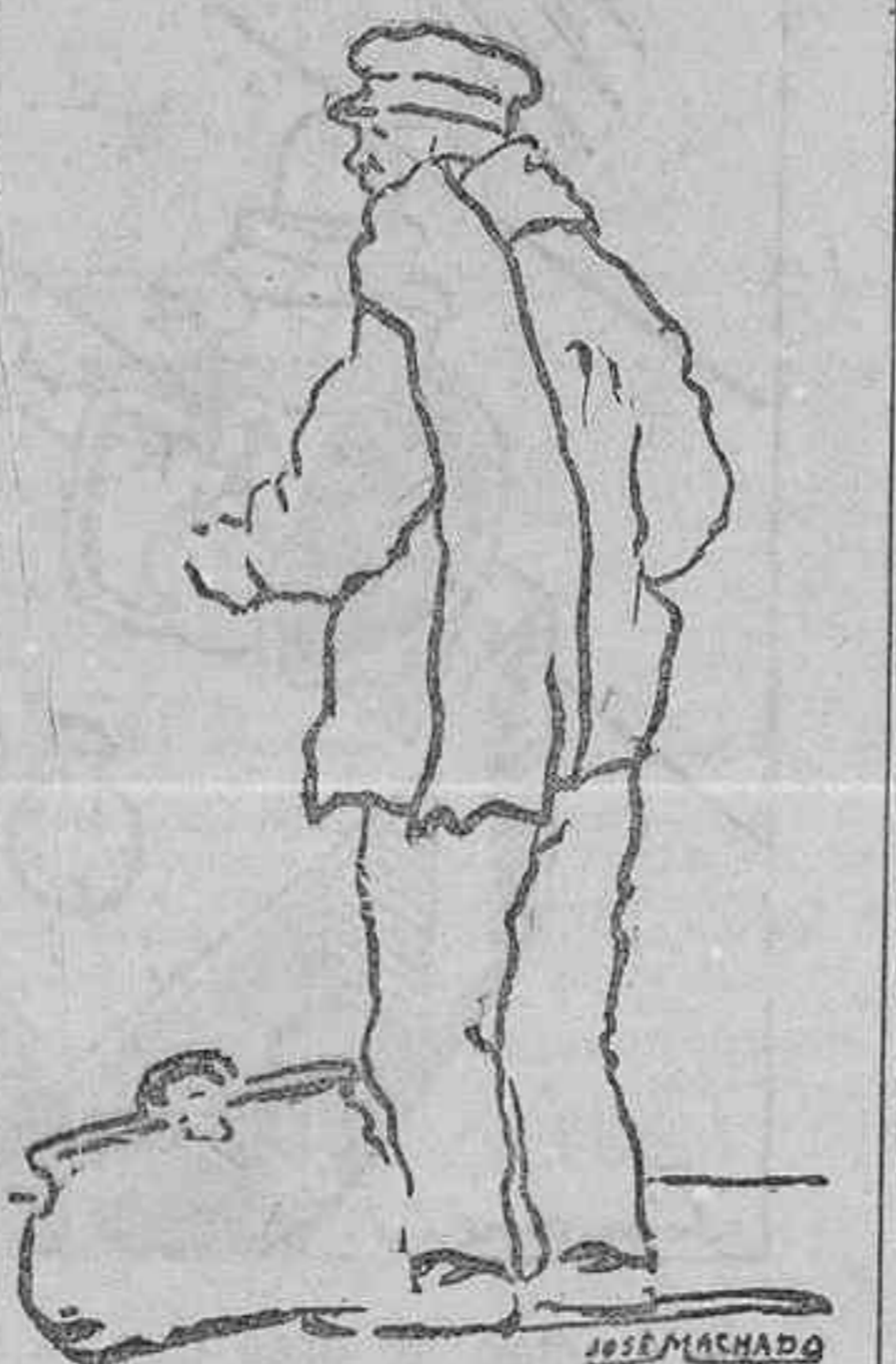
MOZO DE ESTACION Esperando al dueño de la maleta, que no debe tardar en llegar