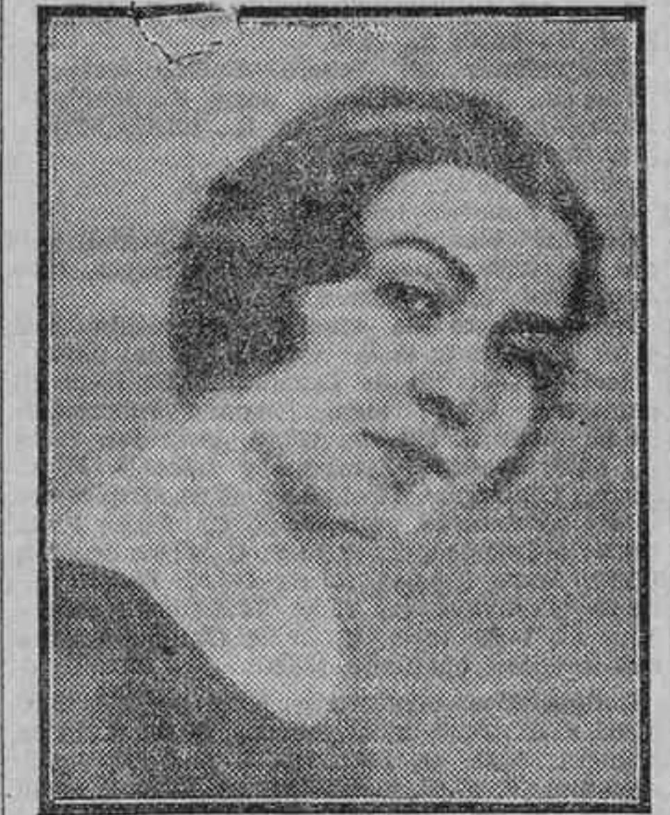
La insigne primera actriz Catalina Bárcena

Es el único actor—esto debiera escribirse con letras de oro—que no tuvo en quince años que