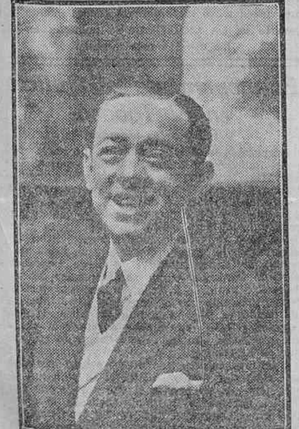
El graciosísimo primer actor Valeriano León