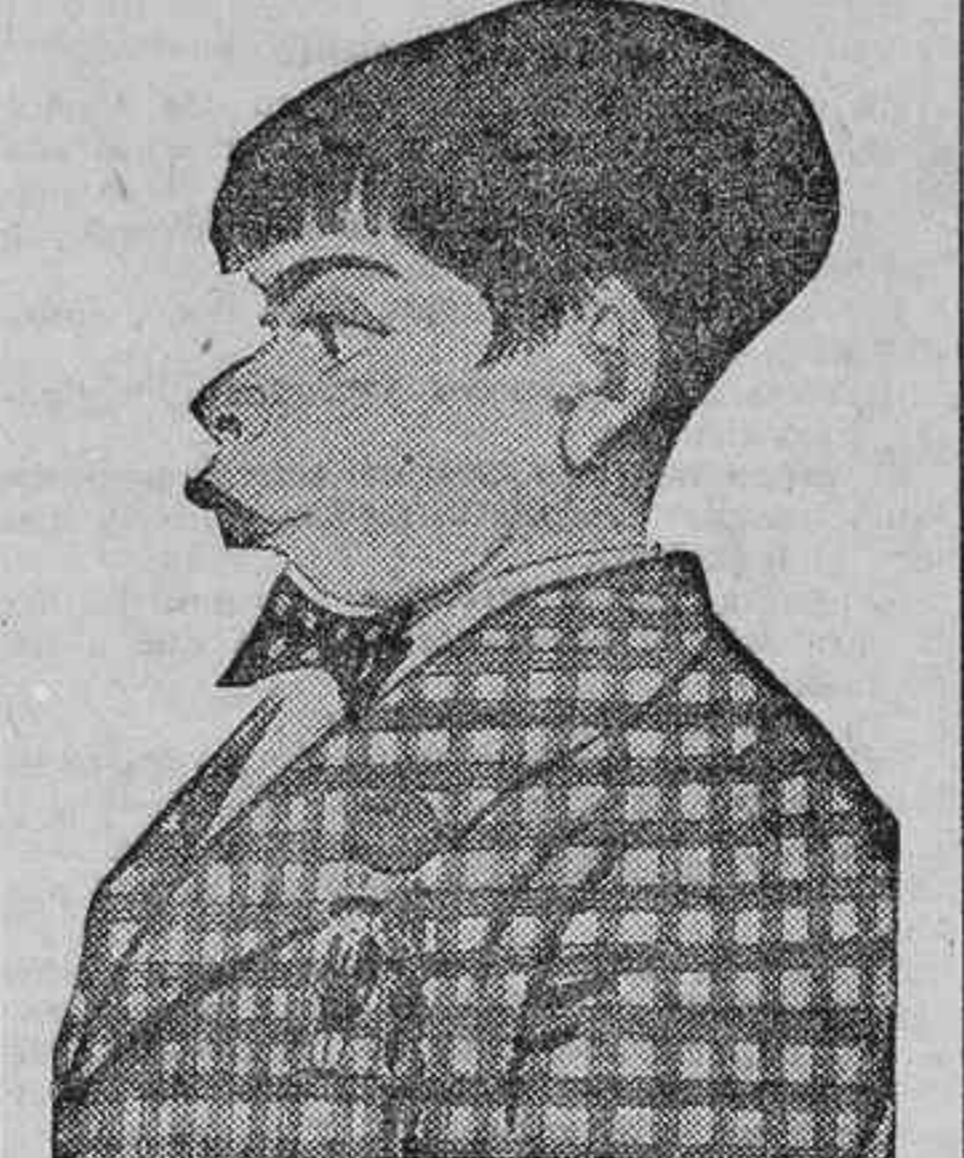
El genial «Narcista»