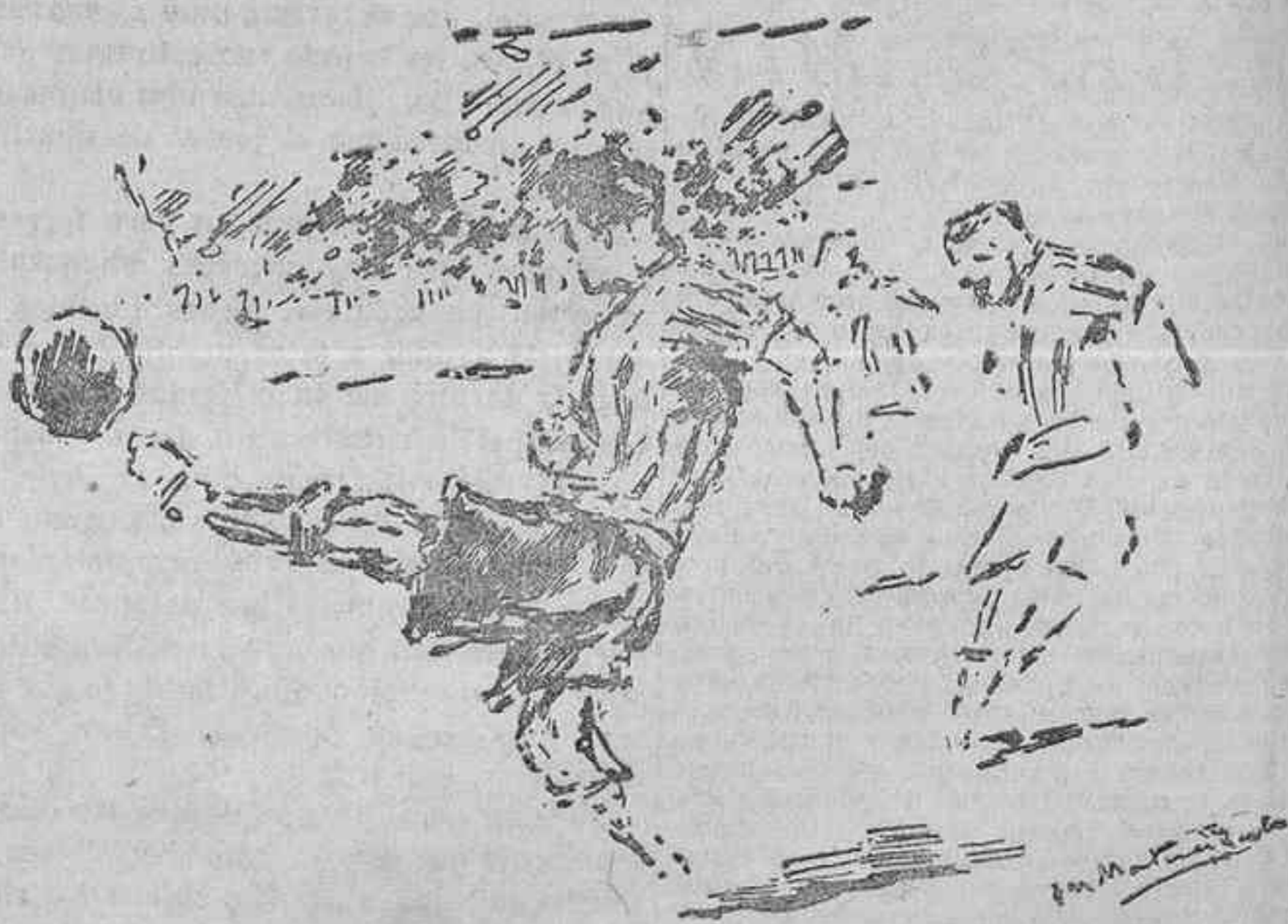
DEL PARTIDO MADRID-ATHLETIC.—UN CLASICO RECHACE DE OLASO (Apuntes del natural por Martínez Bardo.)

Errazquin, al comenzar la segunda parte, marca de cabeza el primer tanto guipuzcoano. Poco después, en un centro de Juañtegui, el mismo Errazquin, también de cabeza, consigue el empate. Arana alcanza el tercer tanto vizcaíno, por fallo de Emery. Pero en seguida, en otro centro de Juañtegui, la cabeza de Errazquin empató nuevamente. De un buen tiro, marca Errazquin el cuarto