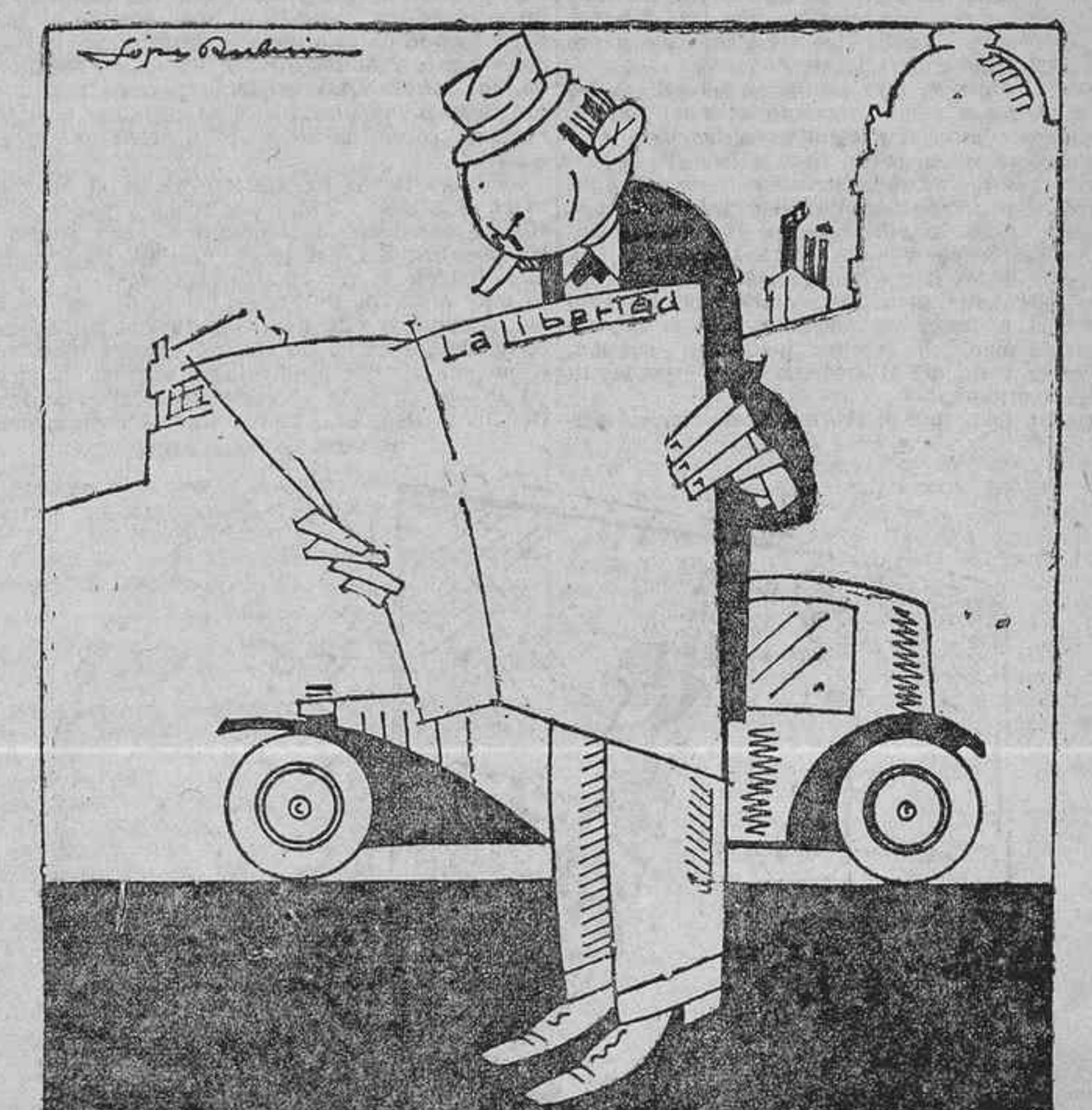
--¡Un té en el aire! ¡Bah! ¡Vaya una novedad! En el aire tengo yo todos los días el cocido y no dicen nada los periódicos.

Lea usted todos los domingos el suplemento literario de LA LIBERTAD. Se publican en él las novelas más famosas