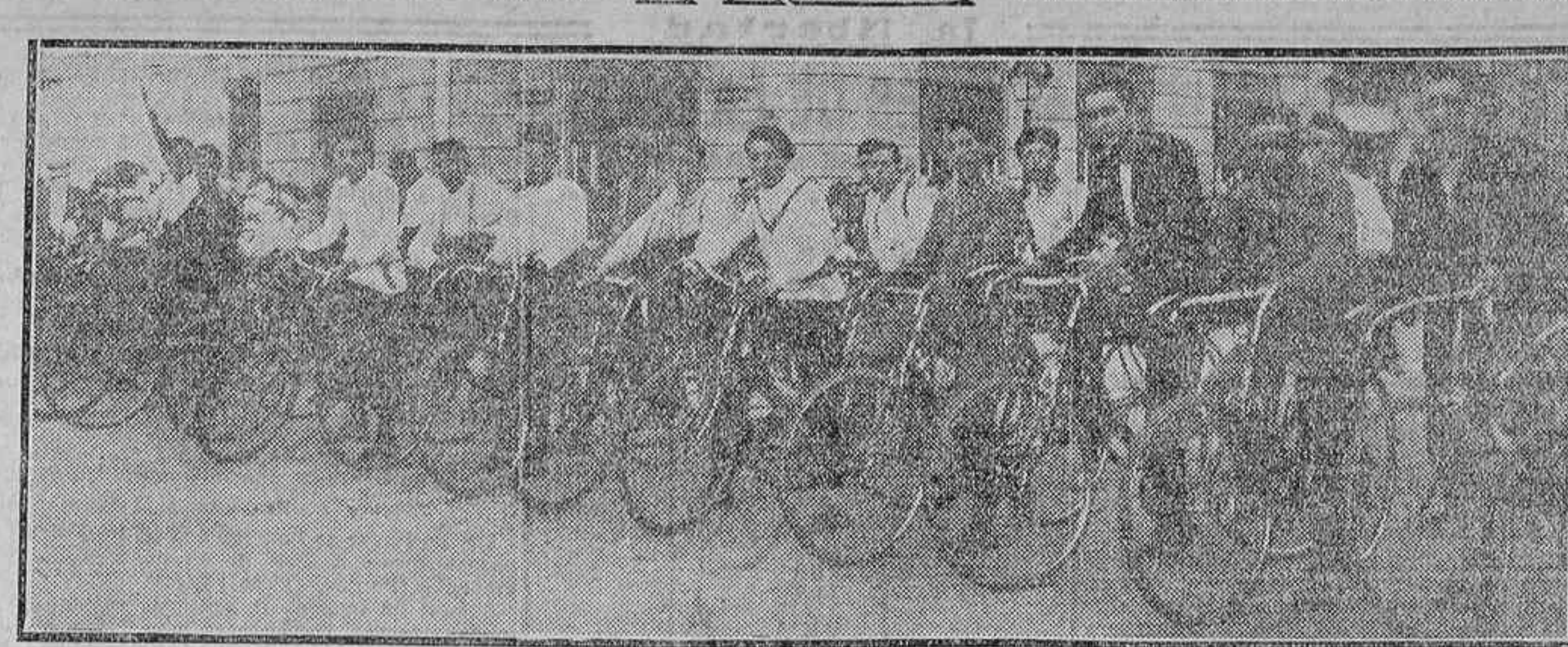
GRUPO DE LOS CICLISTAS QUE TOMARON PARTE EN LAS CARRERAS DE CINTAS, CELEBRADAS AYER EN EL DISTRITO DE LA LATINA

En los veinte años últimos el censo de población española ha crecido notablemente, en tanto que el censo pecuario de la nación ha disminuido en proporciones lamentables.