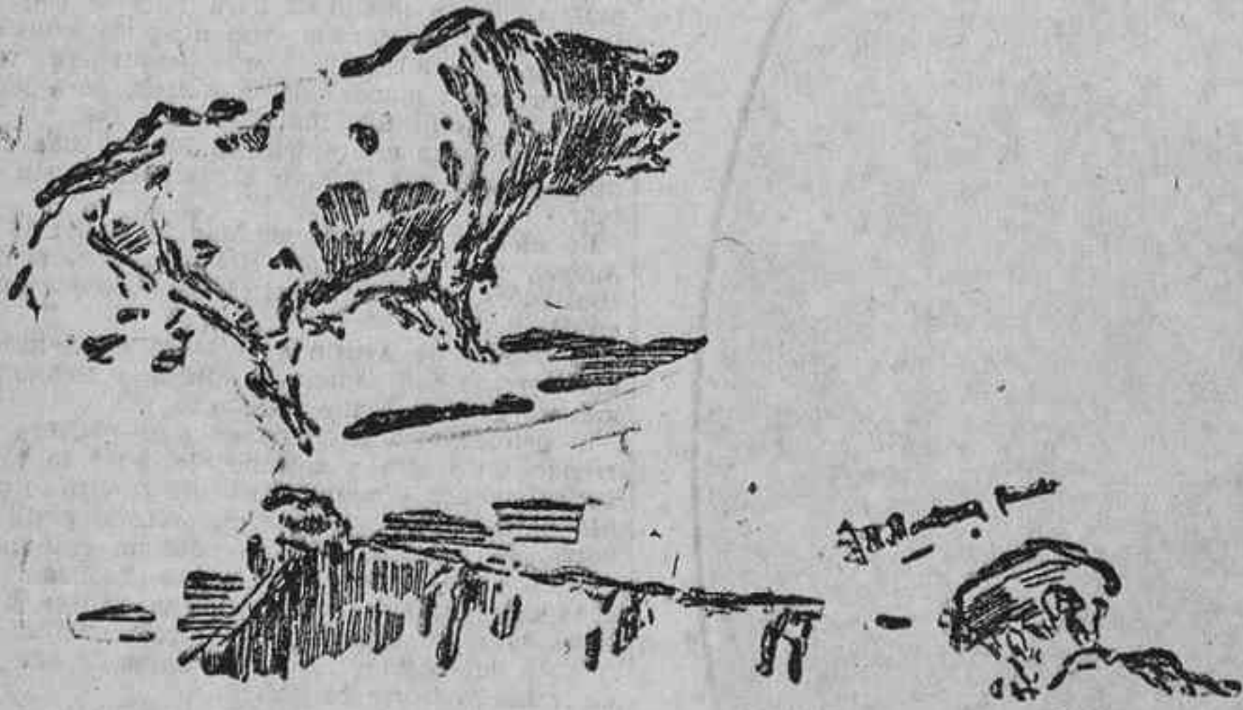
BILBAO.—EL TORO QUE INAUGURO LA FERIA AL PISAR EL RUEDO

Bilbao, 18.—Después de la corrida de ayer, tenía fortuna que salir al ruedo de Bilbao decidido a todo. La fiesta de los toros tiene amarguras muy grandes para los lidiadores, que muchas veces ven como se desmorona en un momento todo el edificio de su fama y de su gloria, y ¡ay de aquel que, cuando vea el estrago, no acuda con prontitud al remedio heroico! Ese está condenado fatalmente a dejar de ser torero; pero el re-