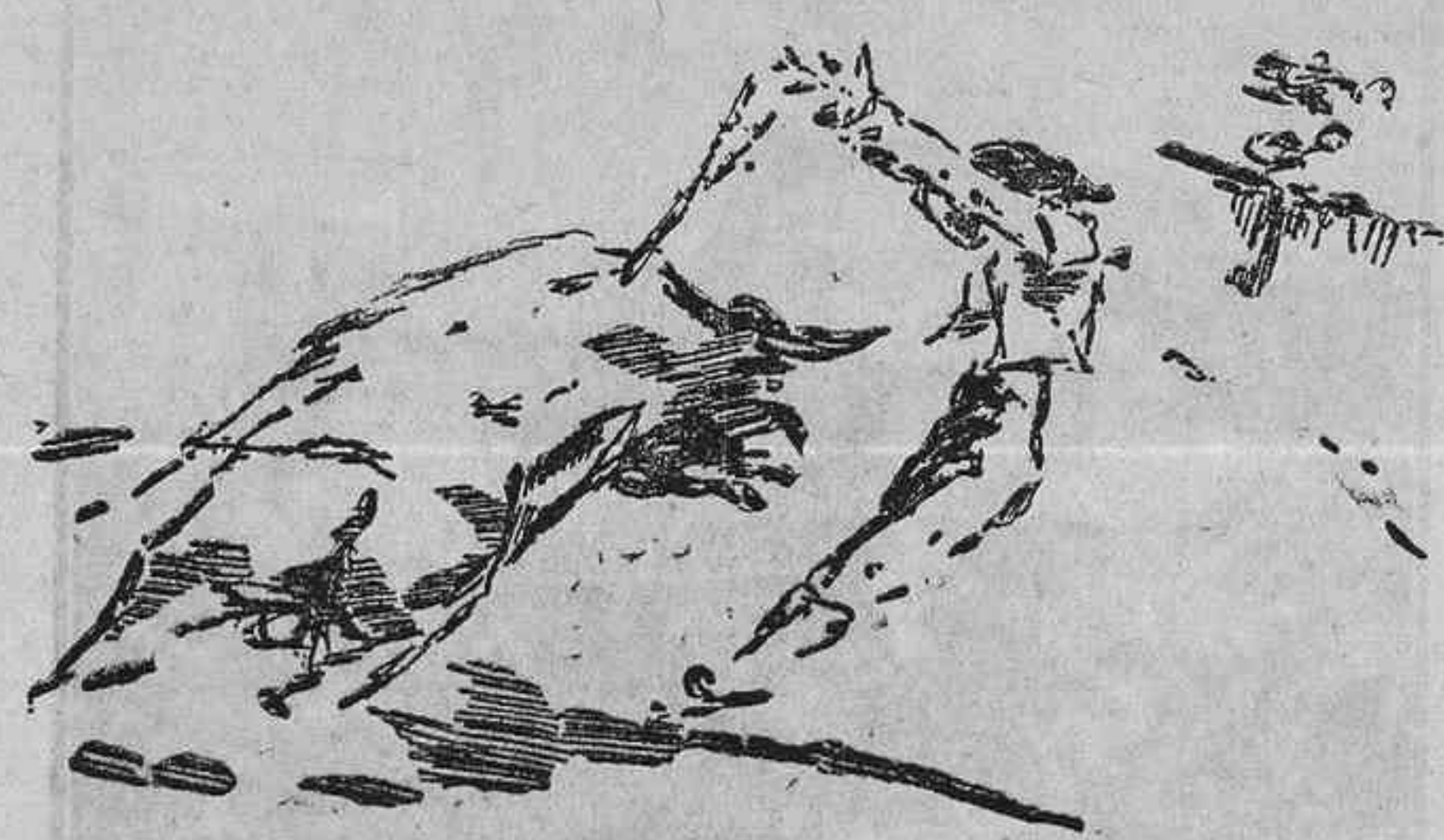
BILBAO.—UN GRAN PAR DE RODAS (Apuntes del natural por Martínez Bandó.)

Complacidos los Sres. Hurtado Tajadura y Ormaechea, no volvíamos a ocuparnos de este asunto, de índole privada, y en el que ya intervinen los Tribunales de Justicia.