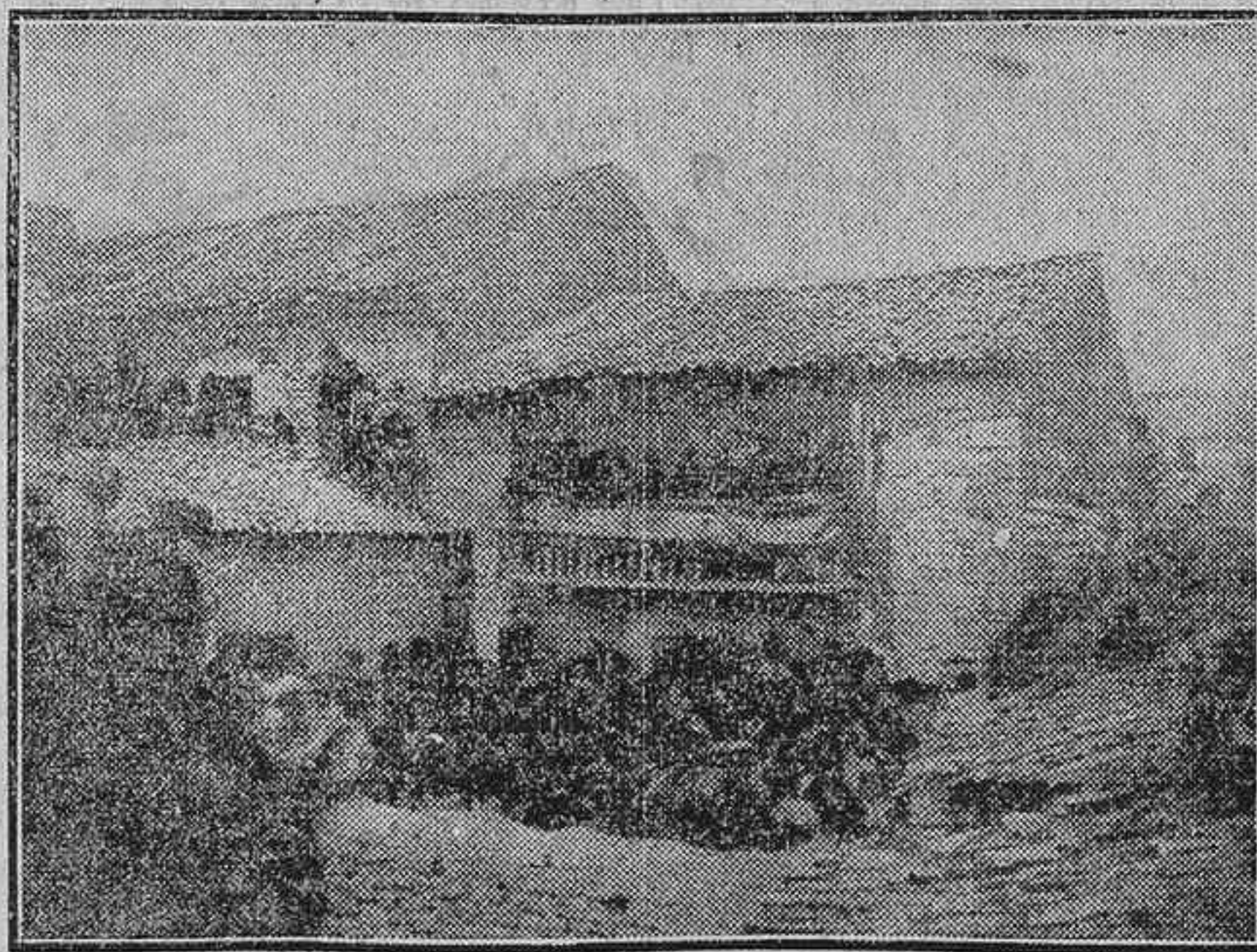
CASA DONDE NACIÓ «EL EMPECINADO», EN CASTRILLO DE DUERO (VALLADOLID)