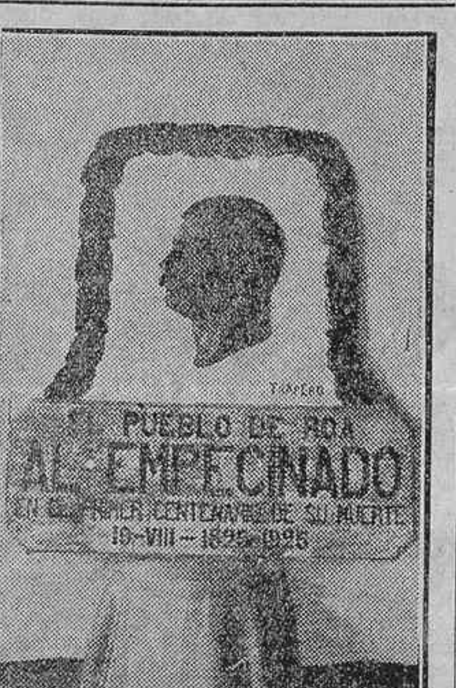
Lápida conmemorativa del centenario de El Empecinado, obra del escultor Florentino Trapero, que será descubierta en Roa el día 19 del mes actual.