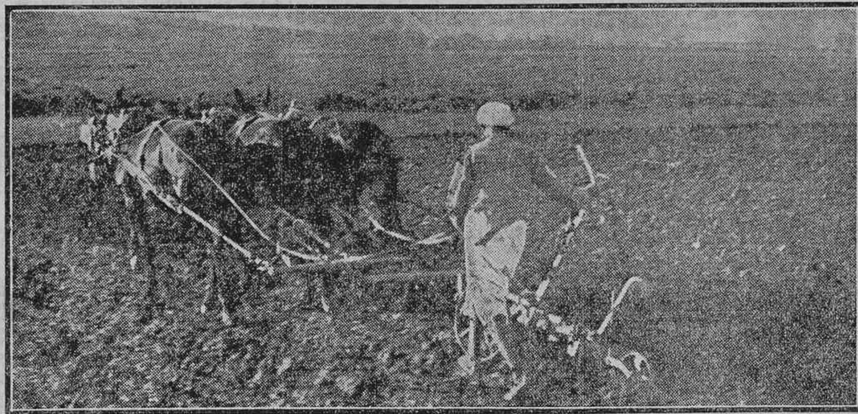
UN MORO TRABAJANDO EN LA GRANJA AGRICOLA DE LARACHE