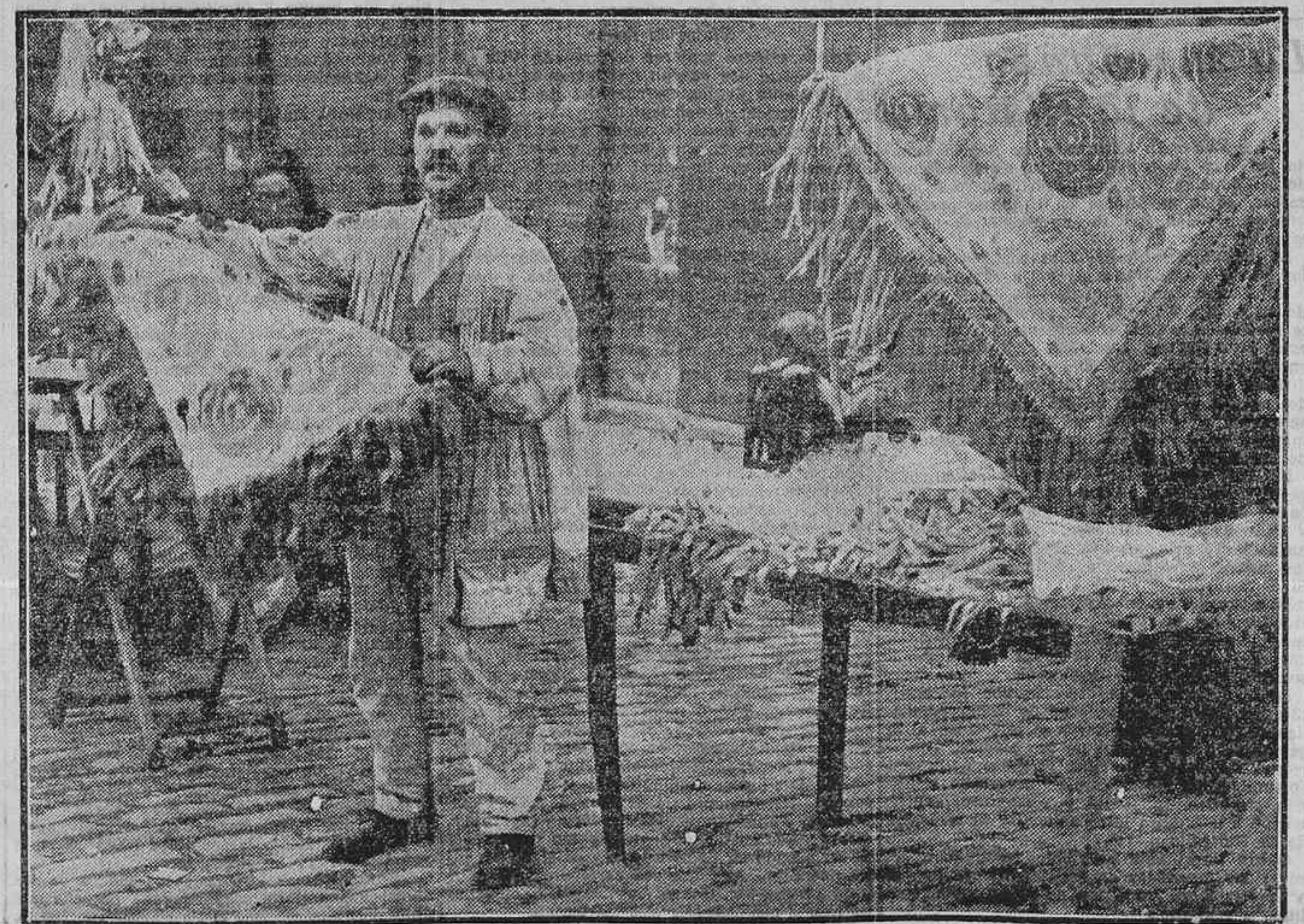
MADRID VEREÑERO.—EL VENDEDOR DE PAÑUJOS DE PAPILO DE MANILA

Por ahora continuarán su campaña en pro-