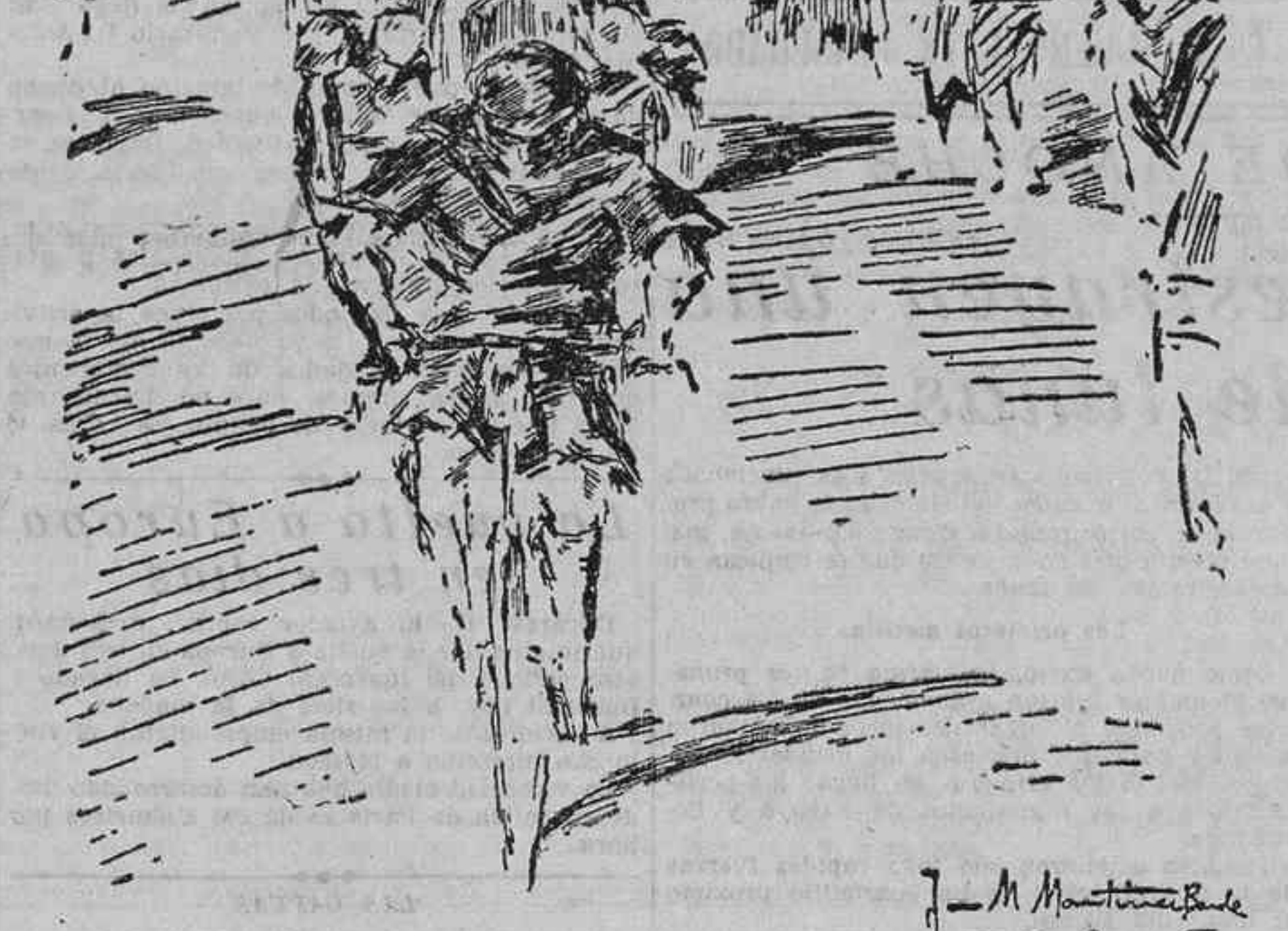
JOSE PE DURANTE LA CARRERA CICLISTA DE LA VUELTA AL PAIS VASCO (Apunte del natural por Martínez Bande.)

Como probablemente la Federación Española concertará para el 16 del corriente el «match» de «water polo» España-Portugal, los nadadores