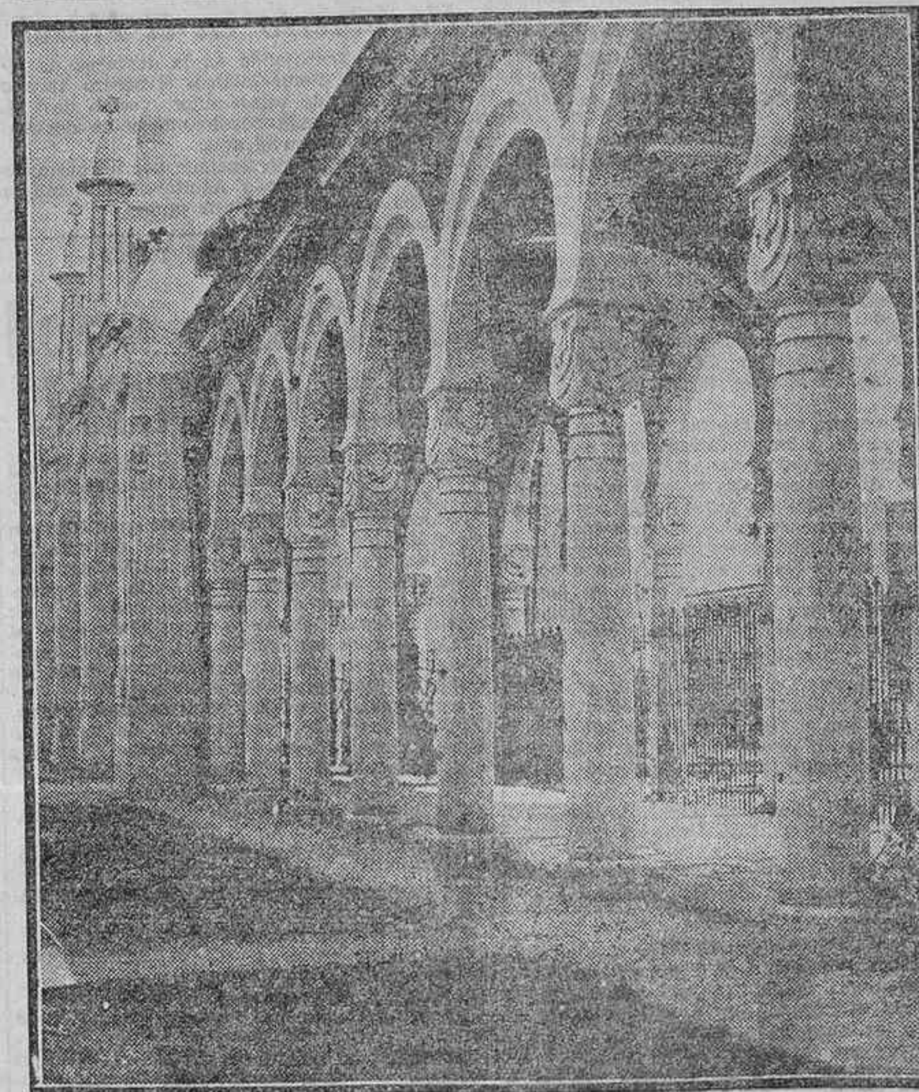
DETALLE DE UNA DE LAS GALERIAS DE LA NUEVA NECROPOLIS DE MADRID

te cualquier accidente que ocurriese. La sala podrá ventilarse artificialmente, haciendo una toma de aire en el exterior, que, calentado por medio del vapor de agua, penetrará en la sala por orificios practicados en sus paredes.