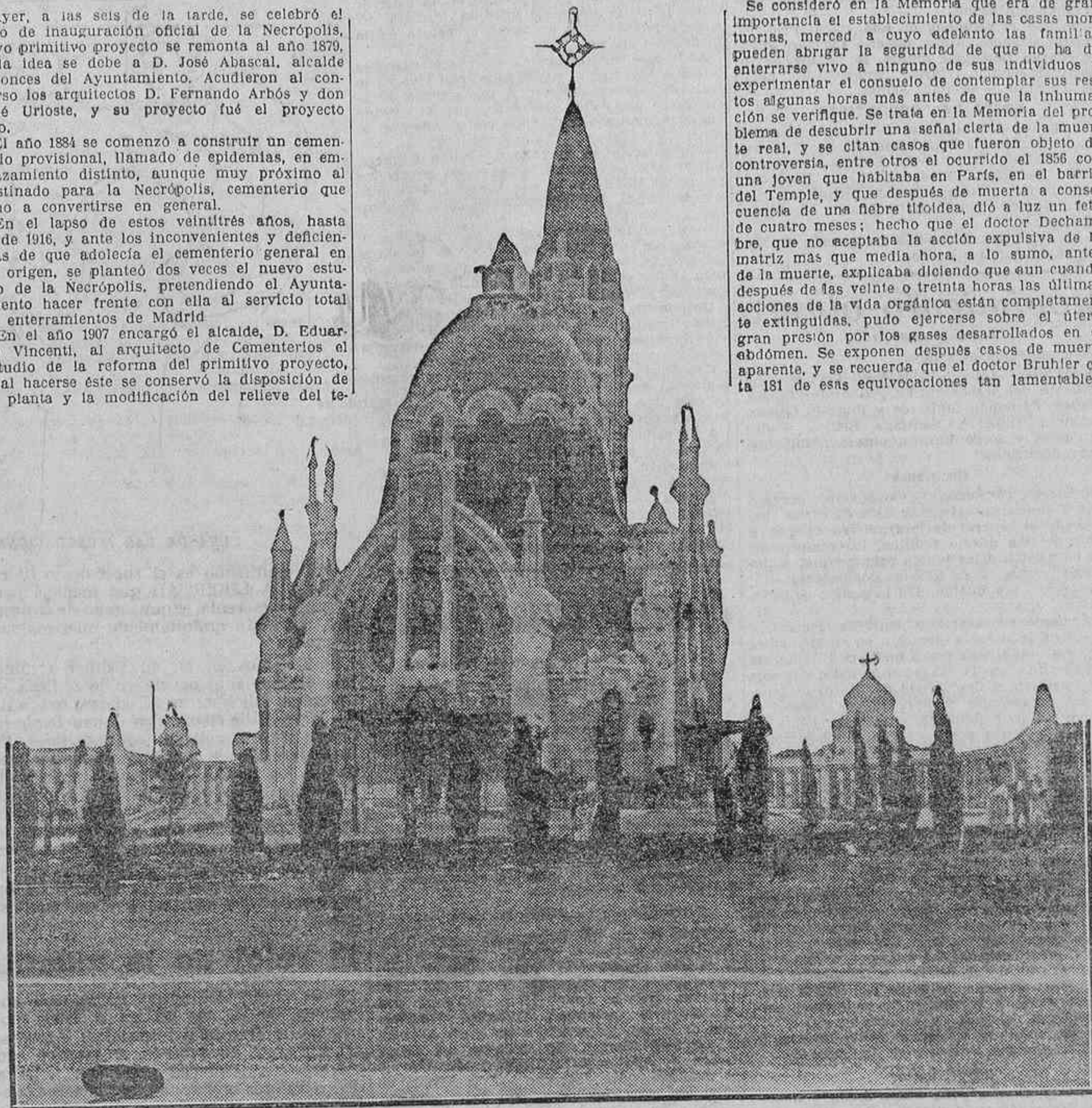
VISTA PARCIAL DE LA NECROPOLIS INAUGURADA AYER EN MADRID

En el año 1907 encargó el alcalde, D. Eduardo Vincenti, al arquitecto de Cementerios el estudio de la reforma del primitivo proyecto, y al hacerse éste se conservó la disposición de la planta y la modificación del relieve del terreno, que tan acertadamente estaba estudiada en aquél, ampliándose el trazado por la adaptación de nuevos terrenos hasta de diez hectáreas más y el complemento de las zonas exteriores llamadas de defensa. Se introdujo la instalación de nichos y se hizo una nueva base de cálculo, cómputo de duración y presupuesto. El primitivo proyecto edificaba la Necrópolis con ocho millones de pesetas, con la base de 7.000 inhumaciones anuales, y el presupuesto del nuevo estudio fué de diez millones, y uno especial de contrata de 8.856.000 pesetas, con una base de inhumación anual de 17.700, y revistiéndose de ladrillo las sepulturas, cosa que no se hacía en el primitivo proyecto.